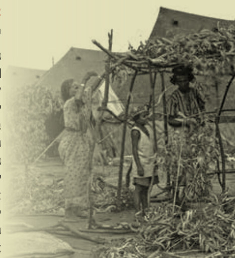
כאן: עין שמר, סוכות תש"י