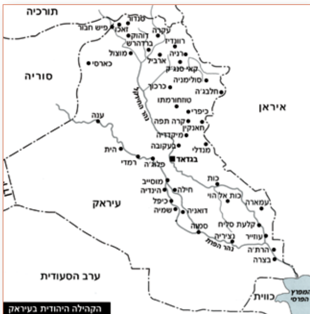
הקהילה היהודית בעיראק

באותה תקופה חיו בעיראק כ-135,000 יהודים, שהיו כשלושה אחוזים מכלל האוכלוסייה. מרביתם התגוררו בערים בגדאד (כ-90,000 יהודים), בצרה (כ-10,000) ומוצ'ל (כ-6,000 יהודים). שורשי יהדות עיראק נעוצים בגלות בית ראשון לפני כ-2,600 שנה. לקהילה הייתה תודעה גאה של שייכות למקום ישיבתה, וקבריהם המסורתיים של הנביא יחזקאל ועזרא הסופר היו בבעלותה. באמצע המאה ה-20 הייתה יהדות עיראק השנייה בגודלה מבין הקהילות היהודיות בארצות האסלאם, אחרי מרוקו, והעשירה ביותר - בצד יהדות מצרים. בני המעמד הגבוה והבינוני של יהודי עיראק עסקו במסחר ובבנקאות, מילאו תפקידים בכירים במנהל הציבורי ובחברות פרטיות, ומרבית היבוא של עיראק היה בידי סוחרים יהודים. בצדם הייתה שכבה של בעלי מקצועות חופשיים וכן בעלי מלאכה, סוחרים זעירים, מורים, פקידים ועוד.