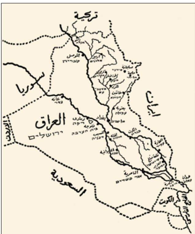
סניפי "החלוץ" בערי עיראק, 1944 - בגדאד היא תל־אביב...

כמה אלפי יהודים, ומאות מהם הגיעו לישראל. חודשים אחדים לאחר מכן הוקם ארגון ציוני בגדאד, שהביא לעלייתם של מאות צעירים ש"גנבו" את גבולות עיראק וארץ ישראל בבקשם להגשים את החזון הציוני. דרכי המעבר הללו נחסמו בסוף 1947, לקראת פרוץ מלחמת העצמאות. רק בראשית 1949 התחדש זרזיף העלייה מעיראק. היוצאים עשו את דרכם