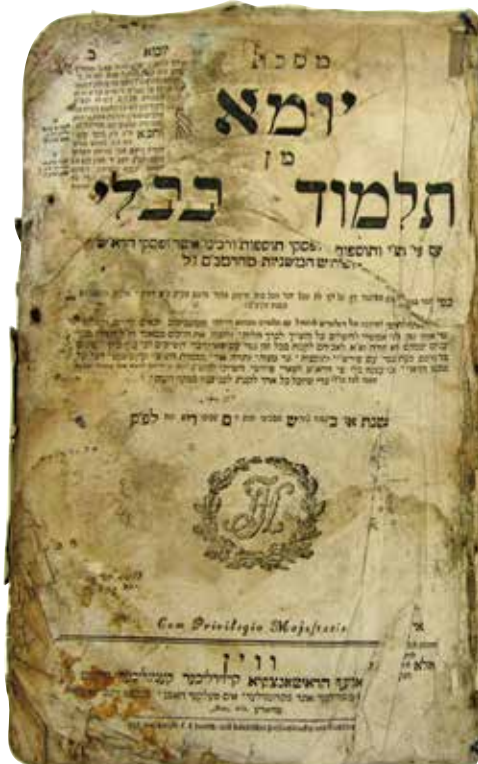
תלמוד בבלי (וינה, 1792) שנמצא במפקדת שירותי הביטחון בבגדאד, 2003