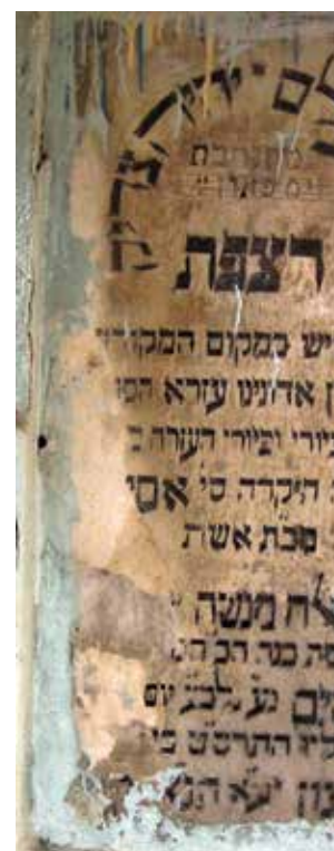
שלט הקדשה בקבר עזרא הסופר ליד בצרה, 2008

לגבול איראן, הועברו בחשאי באמצעות מבריחים מקומיים ואז המשיכו לטהראן; משם ארגנה ישראל את הטסתם ארצה. זרם הבורחים לאיראן הלך וגבר, ובראשית 1950 עברו בנתיב זה אלפי אנשים.