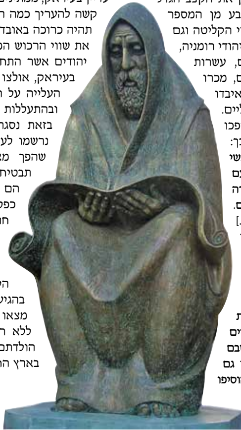
פסל לזכר הרוגי הפרהוד ועולי הגרדום בעיראק (רמת גן; פיסול: י' שפירא)

בזאת נסגר המעגל. רובם של יהודי עיראק נרשמו לעלייה מבחירה, בכוונה לעזוב מקום שהפך מאיים ובציפייה שהעלייה לישראל תבטיח עתיד טוב יותר להם ולילדיהם. הם לא העלו בדעתם שיגיעו לישראל כפליטים נרדפים ומגורשים וחסרי כול. חוק הוויתור על הנתינות כשלעצמו לא היה פעולה של גירוש, אולם בשלבי הביצוע הוא הפך להיות גירוש בפועל. גם אם רשמית לא היו יהודי עיראק פליטים, כיוון שמיד בהגיעם לישראל קיבלו אזרחות, הרי הם מצאו עצמם בארץ זרה, בתנאים קשים, ללא רכושם וללא אפשרות לחזור לארץ הולדתם. זאת הייתה נקודת ההתחלה שלהם בארץ החדשה.