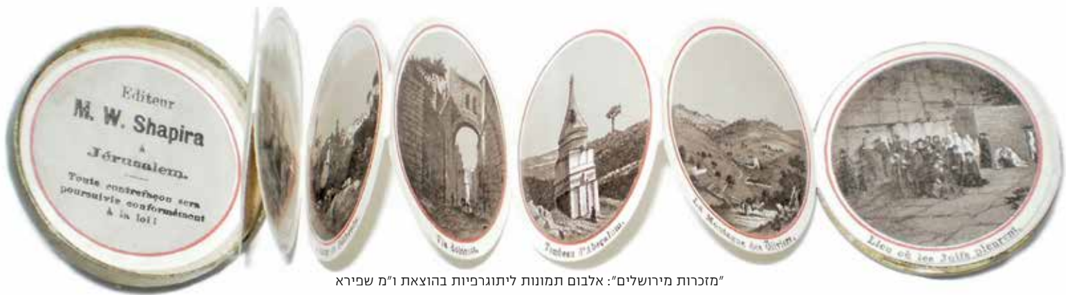
"מזכרות מירושלים": אלבום תמונות ליתוגרפיות בהוצאת ו"מ שפירא

לירושלים. ראשית עבודתם הייתה ה'שונתא' [...] בעבודה זו התחרה אתם אחרי כן מר שפירא הידוע, שהתנצר [...] ואולם לא הרבה זמן עסקו בזה, כי האבנים שעליהן נחקקו הצורות נשברו" (י"י ריבלין, "רבי יואל משה סלומון הסופר והעורך", קובץ מאמרים לדברי ימי העיתונות בארץ ישראל, תל אביב 1985, עמ' 6-7).