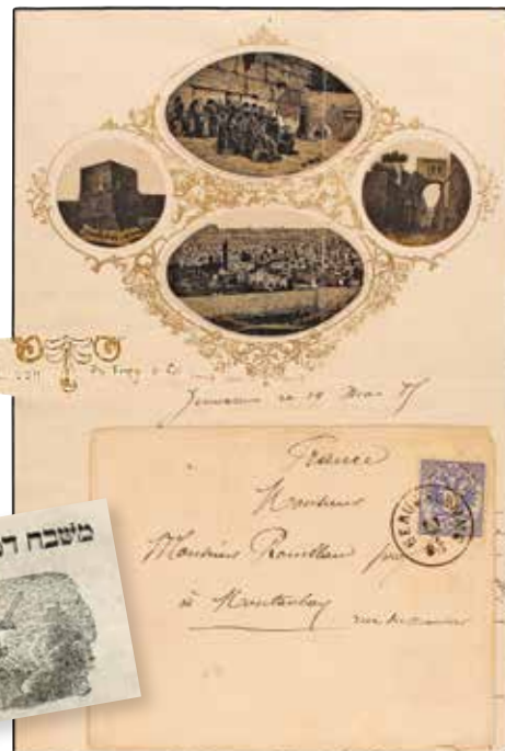
מכתב ועליו תמונות זהות לשונתא, 1885

בכסף נדונייתם שהמציאו להם מירושלים קנו החברים מכונה ומכשירים למלאכה זו. אף רכשו להם אבנים שתמונות המקומות הקדושים בארץ-ישראל חקוקות עליהן, ובהן שבו