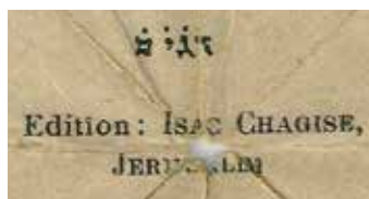
שם העורך בצד האחורי