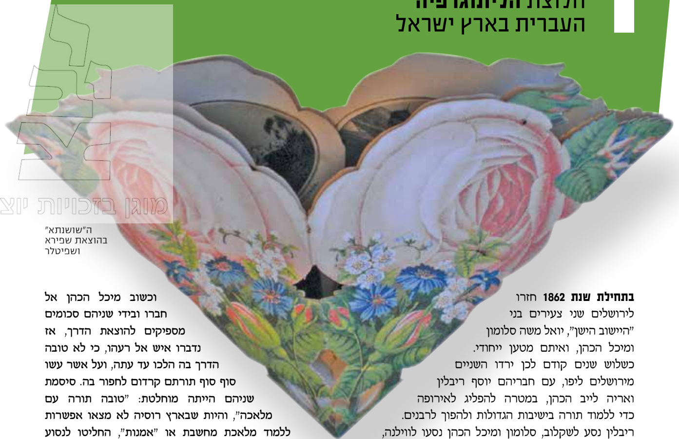
ה"שושנתא" בהוצאת שפירא ושפיטלר