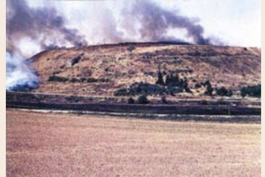
שרפה בתל לכיש (1982), אחת מני רבות בתולדות האתר

ממצא מפתיע נחשף בשער העיר בתוך שכבת שרפה: כלי מתכת ובהם לוח ברונזה, שבשוליו מוטבע הסמל המלכותי ("כרטוש") של רעמסס השלישי, מראשית המאה ה-12 לפנה"ס. נראה שהלוח נתלה בכניסה לעיר, לציון מעמדה במערך השלטון המצרי. עדויות לשרפה העזה שהחריבה את לכיש נמצאו גם באזורים נוספים, אך לא ברור מי הרס את העיר: בני ישראל או המצרים. דוד אוסישקין מייחס את חורבן לכיש הכנענית לשנת 1150 לפנה"ס, ימי המעבר מתקופת הברונזה המאוחרת לתקופת הברזל.