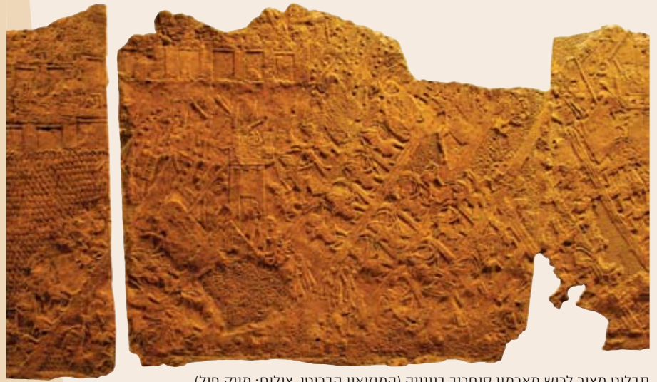
תבליט מצור לכיש מארמון סנחריב בנינוה (המוזיאון הבריטי)

בערב זמר שערך בהיאחזות הנח"ל הסמוכה סיפר זמיר לנוכחים שמראה היונים הפורחות מן הבור היה אחת החוויות המפעימות בחייו.