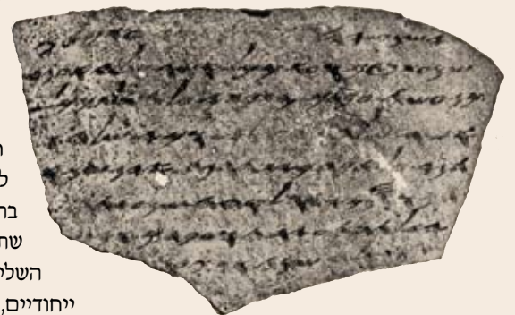
"לכיש 4": מכתב דרמטי מימי המצור הבבלי