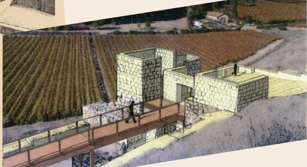
שער העיר בשיא גדולתה (משמאל, איור: יהודית דקל), והשחזור המתוכנן