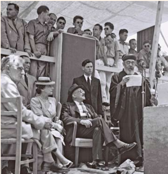
הרב עוזיאל נואם בטקס הנחת אבן הפינה למכון וייצמן, 1946

ואמנם, אם נבחן את קביעתו ההלכתית של הרב עוזיאל במאמרו, ללא הקשרם הפולמוסי, נמצא שהוא אכן אינו טוען שהיהודי החופשי הוא מין ומומר בכל התחומים ההלכתיים, כי אם רק בהקשר הספציפי של צירופו הבעייתי לתפילה. עמדתו זו של הרב עוזיאל באה לידי ביטוי גם בתשובותיו ההלכתיות, ולא רק במאמרו. דוגמה לכך היא תשובתו לרב שלמה מזרחי, רב קהילת הספרדים בלוס אנג'לס, שבה פסק כי כהן המחלל שבת בפרהסיא אינו נושא את כפיו בבית הכנסת, מכיוון שעבירה זו עושה אותו כנוכרי: "לפיכך המחלל שבת בפרהסיא הרי הוא מוציא עצמו ממצות כהונה, בין שהוא מומר להכעיס או לתאבון, כלומר משום הנאת ממון, דזה נמי נקרא מזיד" (משפטי עוזיאל, ח, סימן כד). לעומתו, אגב, הרב השואל פסק להיתר, בניגוד לדעת הציבור בבית הכנסת, כיוון שבעיניו: