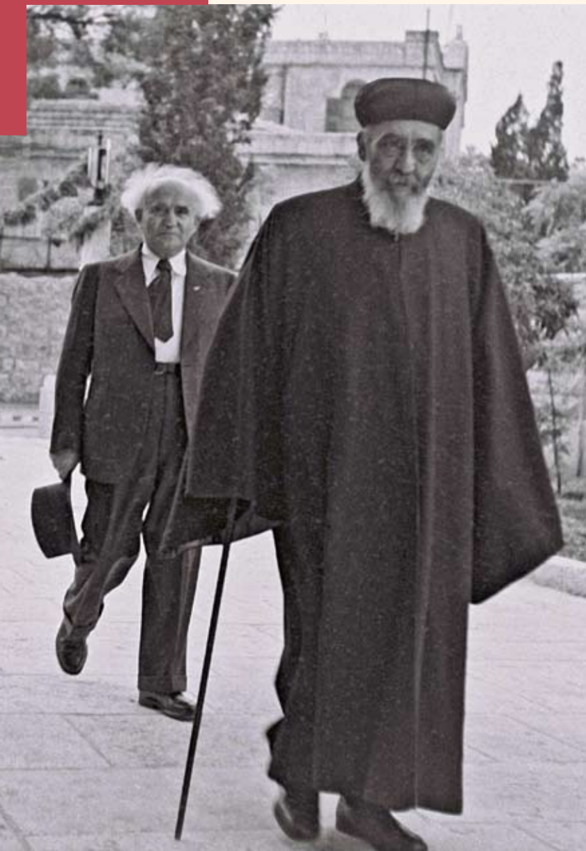
הרב עוזיאל ורה"מ בן גוריון בחנות ביה"ס לרפואה באוניברסיטה העברית, 1949

נבחרת בהסכמת ותקנת הצבור (ב"צ עוזיאל, פסקי עזיאל בשאלות הזמן, ירושלים תשל"ז, סימן מד).