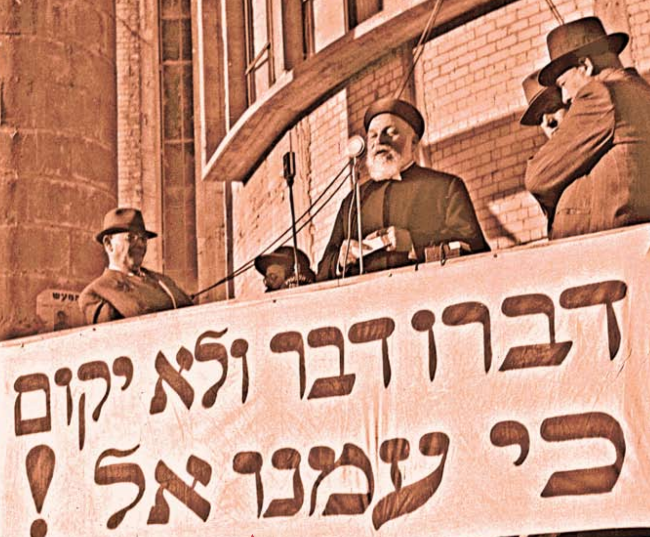
הרב עוזיאל נואם בעצרת מחאה נגד מדיניות "הספר הלבן", תל אביב 1946