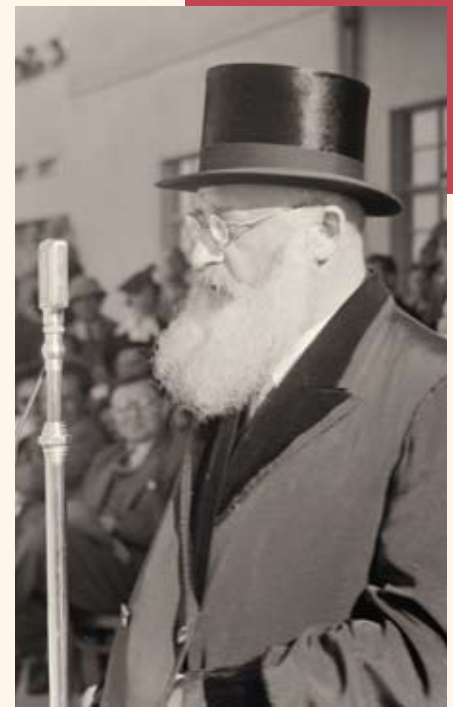
הרב הרצוג נואם בטקס סיום ביה"ס לתעופה, לוד 1939

האודם וכו' והקב"ה נותן בו רוח ונשמה (נדה ל"א) וכל בדיקה מדעית מתבטלת נגד קבלתם הנאמנה של רז"ל שכל דבריהם נאמרו ברוח הקודש, ברוך שבחר בהם ובמשנתם (ב"צ עוזיאל, שערי עוזיאל, ירושלים תש"ו, ב, שער מ, פרק א', סעיף יח דף כג).