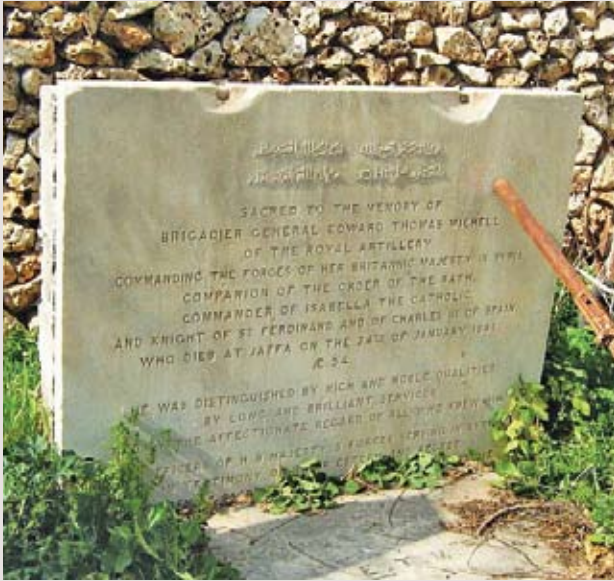
המצבה לזכר מיצ'ל, עם הקדשה בערבית ובאנגלית

הנודע והאהוב, יוכבד גם הוא (The Naval and Military Gazette), 7.9.1844