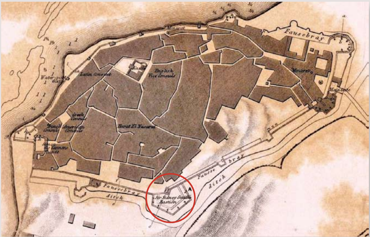
יפו במפת סקייירינג (1842), "מצודת סידיני סמית" במרכז החומה הדרומית