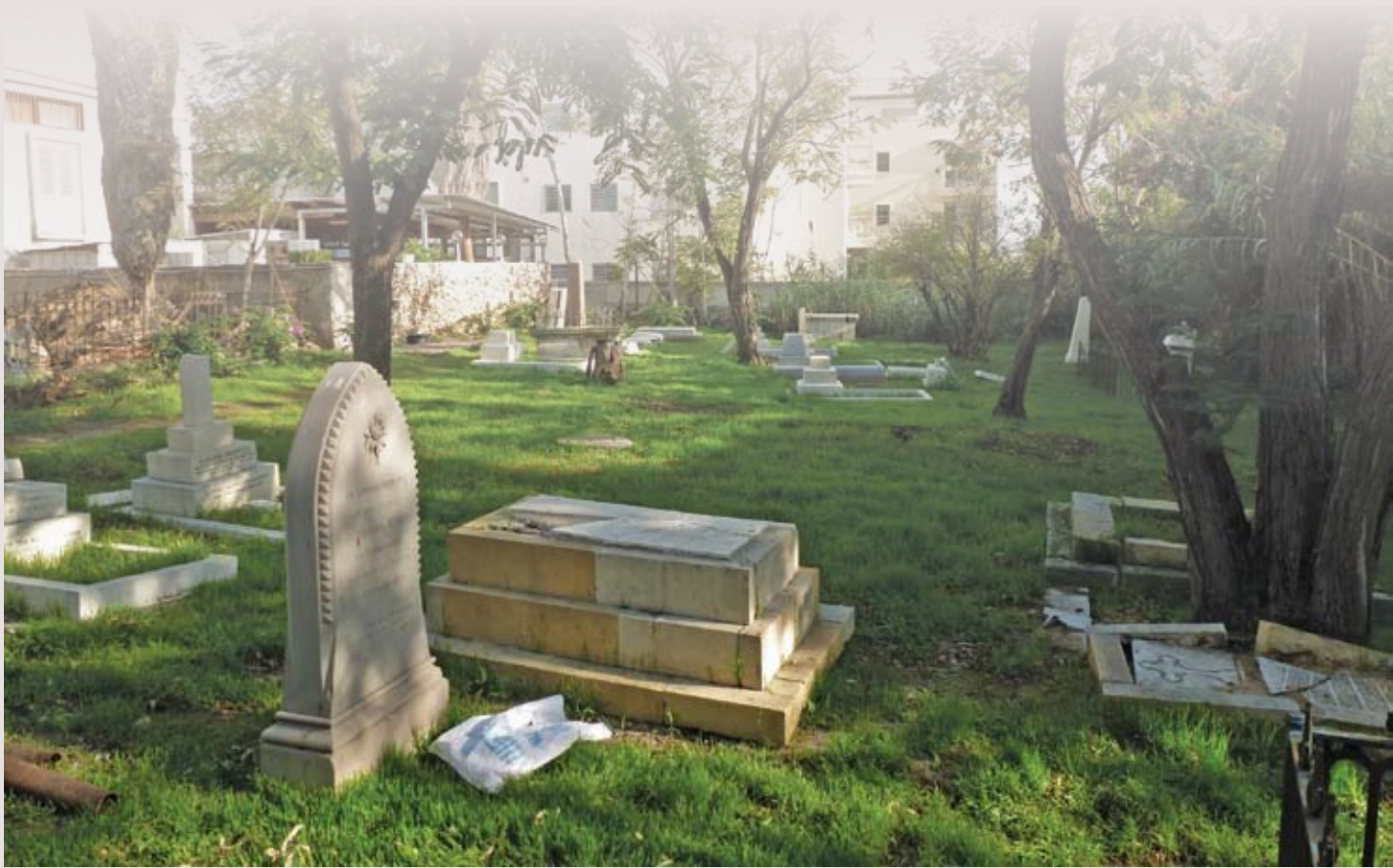
בית הקברות האנגליקני ביפו