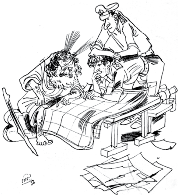
— אולי תיזכר, מוסא, היכן המעכר הנוח ביותר? ...