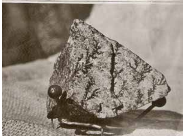
ש"ז כהנא ו"אבן הסנה הבווער" מסיני ("פרחי מנגן")