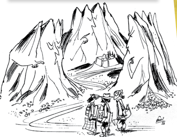
משלחת האוניברסיטה: — אילי תהליטו סוף-סוף, ביניכם, איזה מכס הוא הר האלוהים?

"מבצע קדש" באירוי של שמואל כץ: חיילי צה"ל עם משה רבנו, ומיהו "הר האלוהים"?