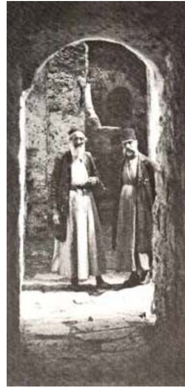
יהודים בחרון, 1921

בחרון בשנות ה־40. בתכנית המוצעת תוקם עיר גדולה (כ־2,000 דונם!) שתוקף בשטחי חקלאות אינטנסיביים; יושם דגש על פיתוח תעשייתי מסורתי ומודרני ועל יזמות פרטית; השותפים לפיתוח יהיו הקק"ל, המחלקה החקלאית, חברת החשמל, בנק אנגלו-פלשתינה ועוד. הוגה התכנית הפנטסטית היה בעל חזון יומרני, אך מציאותי. התכנית משקפת מדיניות התיישבותית אקטיבית ויצירתית, ומלמדת על המאמץ הרב שהושקע בשינוי מפת ההתיישבות היהודית באזור חברון.