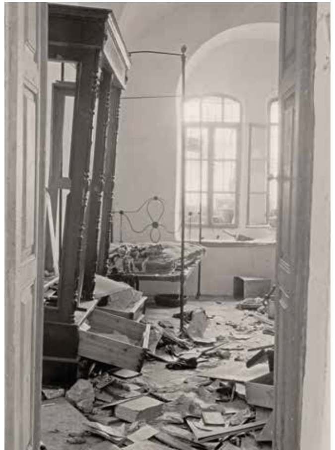
בית יהודי בחברון לאחר פרעות תרפ"ט

"קהילת חברון" – היושבת זמנית בירושלים – חידשה את המאמצים לחזור לעירה. הקהילה מונה כ-180 נפש, רובם ילידי חברון. הם לא ניתקו במשך ארבע שנים את הקשרים עם עירם, ציפו כל הזמן לאפשרות לחזור לשם ומוכנים לזאת בכל רגע [...] את הצעד הראשון לביורר אפשרות חזירתם לחברון עשה ועד הקהילה לפני כחשישים. הוא פנה אל מושל המחוז בבקשה להודיעו מתי יוכלו יהודי חברון לחזור לעירם [...] נראים עתה סימנים של שיפור המצב ויהודי חברון עומדים לעשות צעדים חדשים כדי להשיג אפשרות לחזור לעירם.