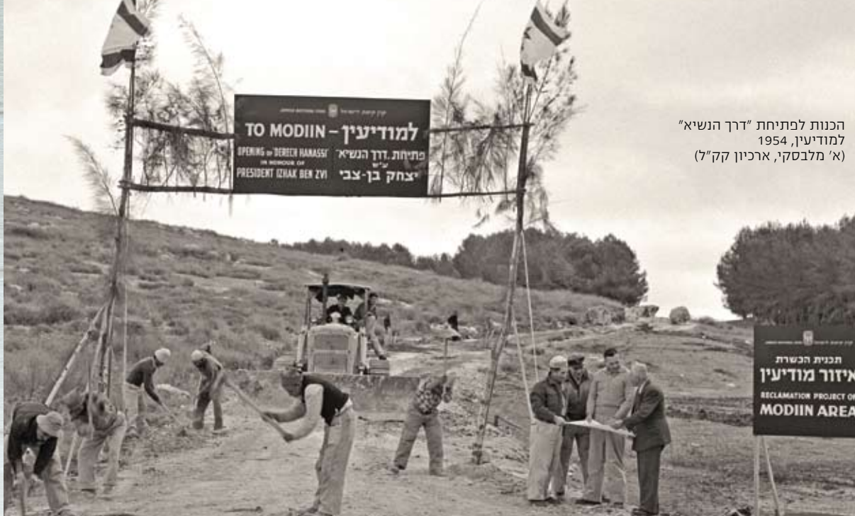
הכנות לפתיחת "דרך הנשיא" למודיעין, 1954

קלה עומדת בפניכם. מחר יעלמו כל החוגגים, הדגלים יקופלו ואתם תעמדו מול המציאות האפורה. מציאות של היאחזות בטרשים ובהרים מסביב. בזכות הוד הגבורה אנו מקווים כי יעמוד לכם הכוח לבצע את המשימה" (חרות, 30.11.1964). בתום הטקס ניטעו שבעה עצים סמוך לקברי המכבים לזכר מתניהו החשמונאי, רעייתו וחמשת בניו, בידי הנשיא שז"ר, הרמטכ"ל רבין, סגן שר הביטחון שמעון פרס, סגן שר החינוך הרב ד"ר קלמן כהנא, אלוף פיקוד המרכז יוסף גבע, יו"ר דירקטוריון קק"ל יעקב צור ורחל ינאית בן-צבי. שבעת השתילים היו הגרעין ל"יער המכבים", שנטעו חברי תנועת "המכבי" לרגל המכבייה השביעית בשנת תשכ"ה (1965).