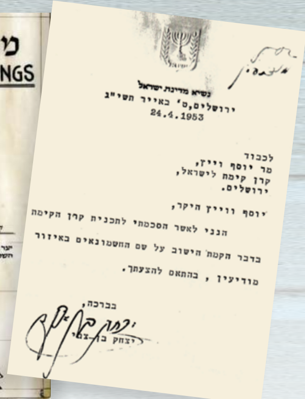
אישורו של בן-צבי לתכנית ויץ (1953) ומפת התכנית היישובית

לקברי המכבים, ו"שמעון הנשיא" – בנו של מתתיהו וממנהיגי המרד, כהן גדול, ונשיא היהודים. ב-16.12.1954 דיווח עיתון "הצפה" שקק"ל החלה להכשיר 10,000 דונם להתיישבות, מתוכם 4,000 דונם לעיבוד חקלאי אינטנסיבי ו-1,000 דונם לנטיעת יער. בנוסף החלו לפרוץ דרך בין בן-שמן לבין שני היישובים המוקמים, שנקראה "דרך הנשיא" – לכבוד בן-צבי.