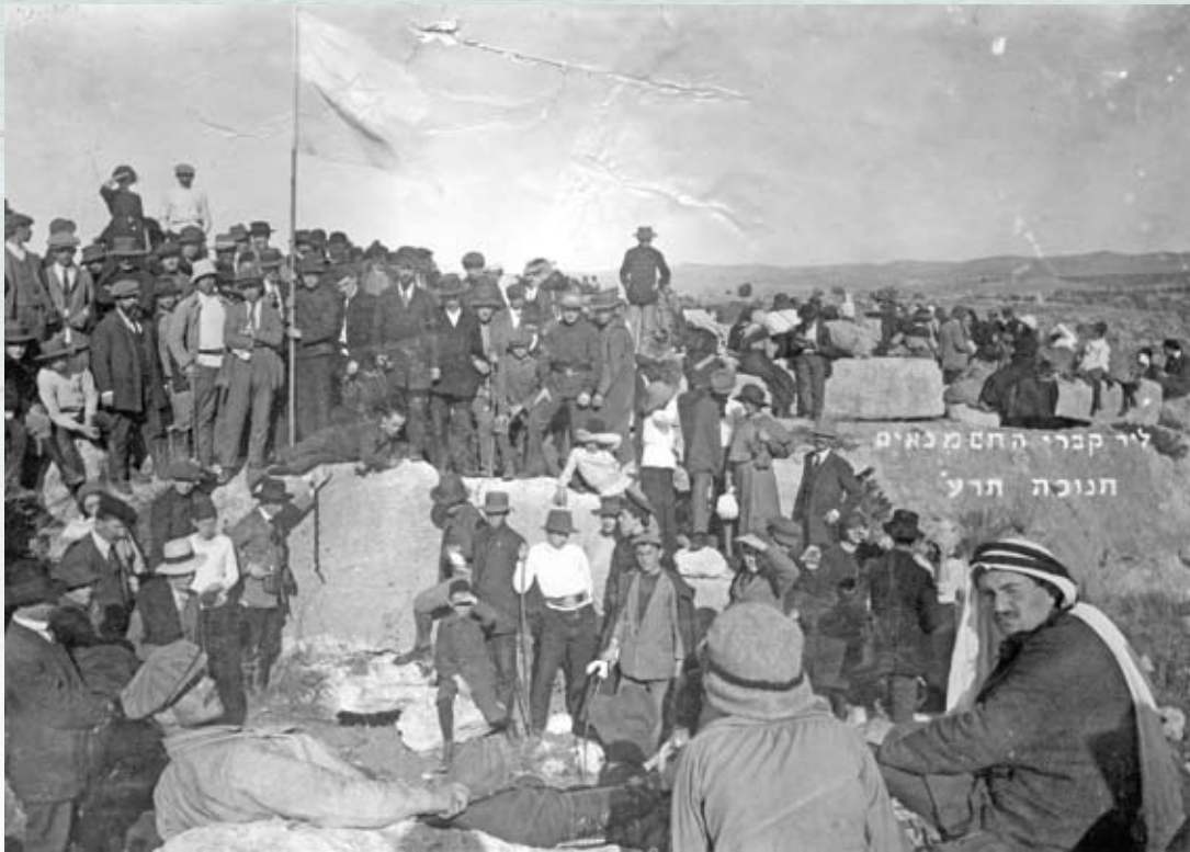
חנוכה ב"קברות המכבים", תר"ע

יש נחמה בכך שכיום הזיהוי אינו מקובל והשרידים באתר מתוארכים לתקופה הביזנטית. בשלהי קיץ תרס"ט (1909) סייר יצחק בן-צבי במקום, וכתב: "והנה אנחנו במודיעים. זהו כפר קטן, מזוהם, נידח. אל-מידיה' שמו בערבית [...] והנה הם לפנינו – הקברים הקדושים. הללו נחצבו בסלע הקשה ונסתמו בגוללי-אבנים [...] זהו מקום מנוחתם של החשמונאים? האלה קבריהם של גדולי גיבורינו?" (י' בן-צבי, רשמי דרך, ירושלים תשל"ב, עמ' 83-84). בעקבות סיורו פרסם בן-צבי מאמר בעיתון "השלח" בנושא "הגורמים הכלכליים של מרידות החשמונאים". באותן שנים החלו מורי ותלמידי הגימנסיה העברית במסורת העלייה לרגל ל"קברי המכבים" בחנוכה, והאתר הפך לסמל לאומי. משנת תש"ה (1944) הנהיגו חברי "מכבי הצעיר" בחנוכה את "מרוץ הלפיד", שיצא מקברי המכבים והועבר בידי רצים לרחבי הארץ. לאחר הקמת המדינה נהג הנשיא להדליק מאש הלפיד את החנוכייה במשכנו.