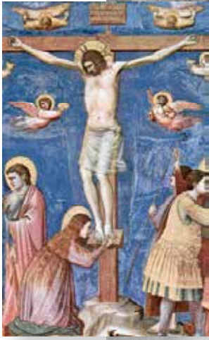
ישו בקיבוץ: תרגילי פרסקו באפיקים, וציור של ג'וטו