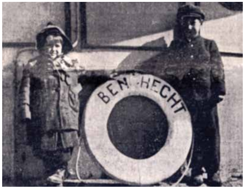
"בן הכט", ספינת המעפילים ששירתה אדונים רבים (Wyman Institute)