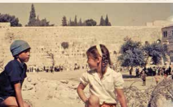
"ילדים וילדות משחקים ברחובותיה", קיץ 1967

לאחר תום הישיבה, יצאו כמה מן האחראים להריסה לסיור בשטח, והחליטו להרוס חלק גדול מהשכונה כדי ליצור רחבה גדולה סמוך לכותל. קבוצת בתים קרובה לכותל מדרום הרחבה ("בתי אל-סעוד") נועדה להישאר ולהינצל מההרס, וכך גם שני רחובות שתחמו את הרחבה ממערב ומצפון. בין המתחמים שנועדו להריסה אמורים היו להיוותר במקומם שני אתרים קדושים למוסלמים: מסגד אל-בוראק וקבר שיח'. המתכננים סימנו על גבי שרטוט של השכונה את האזורים שנועדו להיחרס. הם ביקשו להותיר - אם יתאפשר הדבר - כמה קירות שחילקו את האזור המיועד להריסה לשני מתחמים, ובייחוד את הקיר התוחם את סמטת הכותל ממערב ומפריד בינה בין השכונה. אולם למעשה היה פער בין התכנית