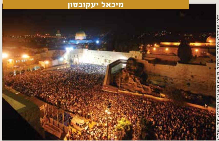
לכו תעלה: רחבת הכותל, תשרי תשע"א