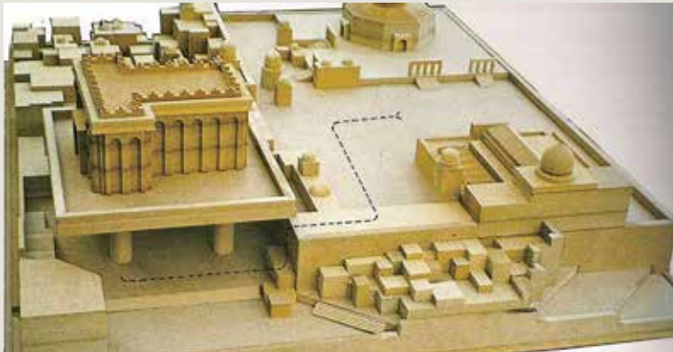
הצעה להקמת מעל רחבת הכותל (דגם: פסח רודר, 1992)

מאז קיץ 1967 , ביקשו אדריכלים רבים להותיר חותם באתר הקדוש ביותר לעם היהודי. רחבת הכותל, חצר קטנה וסגורה ששטחה כ־120 מ"ר, הייתה לפתע לרחבת ענק בשטח כ־200 אלף מ"ר. כבר ביולי 1967 נשכר האדריכל יוסף שנברגר להתוות תכנית ראשונה לרחבת הכותל, אלא שמיד קמה התנגדות מצד גורמים תכנוניים: ועדת התכנון המחוזית דרשה להשתמש באבנים עתיקות "שישתלבו יפה בנוף הכללי של רחבת הכותל והעיר העתיקה", ואילו שנברגר ביקש לעשות שימוש באבנים חדשות; היו גורמים דתיים שדרשו קיר הפרדה גבוה בין רחבת המתפללים לרחבה הציבורית, והיו שדרשו קיר נמוך. לאחר שהרב הראשי יצחק נסים הורה להרוס את מה שכבר נבנה, ניתנה הוראה לעצור את העבודות באתר – והאדריכל ביקש להתפטר. שנברגר ניבא כי "רחבת הכותל לא תעוצב עיצוב טובי ומוגמר תוך פרק זמן נראה לעין, אלא בהדרגה, שלבים שלבים, במשך תקופת זמן ארוכה". "אגודת האינג'נירים והארכיטקטים" דרשה להכריז על תחרות פומבית לתכנון רחבת הכותל המערבי ולשיקום הרובע היהודי. ההצעה נדחתה, אך הניבה הצעות מטובי האדריכלים הצעירים באותה תקופה. חלקם ביקש