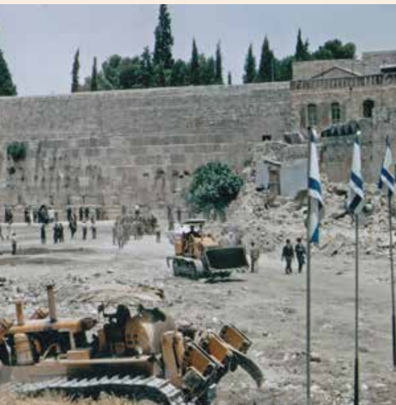
עבודות ברחבת הכותל החדשה, קיץ 1967

בשורטטה בצהרי השבת, שהייתה מוגבלת בהיקפה, לבין הביצוע בשטח. גבולות השטח המיועד להריסה נראו בתכנית בבירור. בפועל חרגו ממדי השטח שנהרס מאלו שנקבעו בה. במוצאי שבת הגיעו אל הכותל חברי "ארגון הקבלנים והבונים בירושלים" - בעיקר המבוגרים שבהם, שלא היו מגויסים באותה עת. לאחר שהתפללו בהתרגשות ואמרו את נוסח ההבדלה, הורה להם בן-משה לסלק את מבנה בית-השימוש הצמוד לכותל. העובדים, שהיו חדורים בתודעה של שליחות היסטורית ובתחושות מיסטיקות, פעלו במרץ ובהתלהבות רבה. תחילה החלו לנתץ את מבנה בית-השימוש בפטישים, אך הדבר ארך זמן רב ובן-משה החליט להביא למקום ציוד כבד כדי לסיים את העבודה במהירות. למקום הובאו דחפורים, שהרסו את בתי השכונה בזה אחר זה. עם תחילת ההריסה פונו תושבי השכונה מבתיהם, ועברו להתגורר במקומות מגורים זמניים ברובע המוסלמי ובשכונות שועפאת, בית-חנינה וסילוואן, עד לשיכונם הסופי במקומות שונים ברחבי העיר. התושבים קיבלו פיצויים עבור דירותיהם ומיטלטליהם. תוך זמן קצר נהרסה השכונה כמעט לחלוטין (למעט קבוצת בתים שנהרסה כשנתיים מאוחר יותר). הרחבה החדשה שנוצרה הועמדה למבחן מייד: בחג השבועות, שחל באותו שבוע, פקדו את הכותל מאות אלפי אנשים.