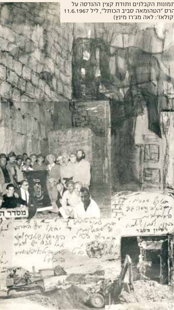
תמונות הקבלנים ותודת קצין ההנדסה על הרס "הטהומאה סביב הכותל", ליל 11.6.1967