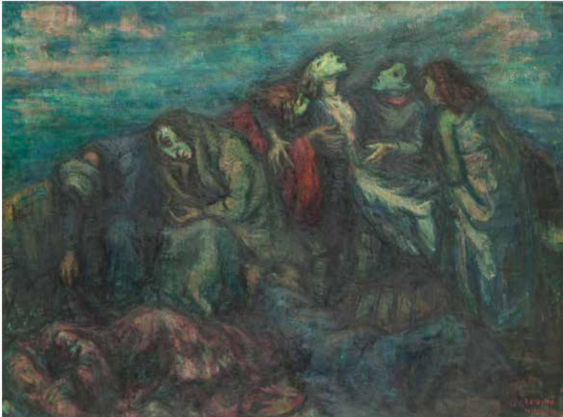
פליטים (ציור: מירון סימה, מאנשי העלייה השלישית, 1946)

העלייה השלישית בצל מלחמת האזרחים באוקראינה