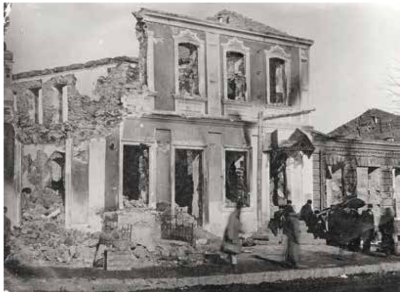
אחרי פוגרום, רוסיה, ראשית המאה ה-20

שעת העלייה לארץ ישראל עדין לא הגיעה. עליה זו אי אפשרית היא עד לא תקבענה התכניות השטחיות של ההתיישבות הבאה ליסודותיהן הכספיים, הכלכליים ולכל יתר סעיפיהן – תכניות הכרוכות בפתרון השאלות הפוליטיות הנודעות לארצנו. עד השעה ההיא אל אף למהגר אחד הכנס לארץ ישראל. מוצאים אנחנו לנחוץ להדגיש את אזהרתנו זו לכל החברות והיחידים באופן הכי נמרץ בכדי שימנעו מכל צעד נמהר כלפי הגירה