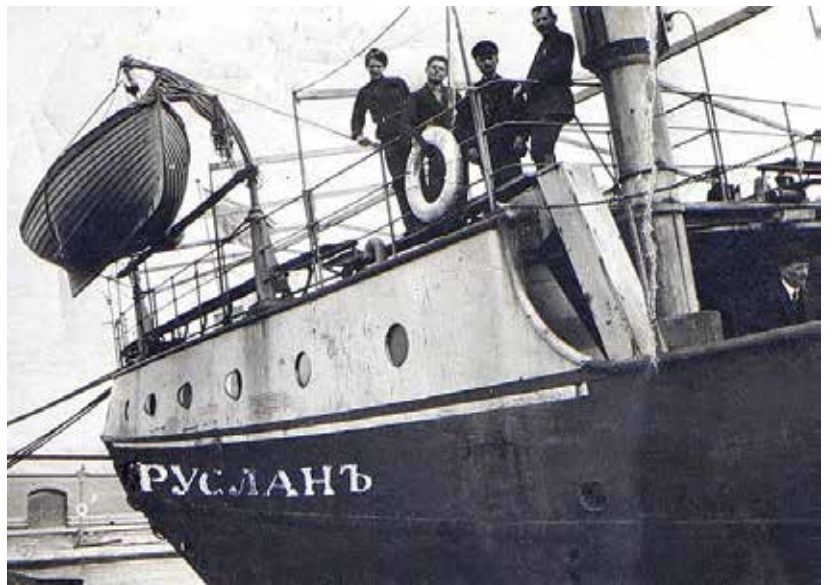
"רוסלאן", 1919 (הארכיון הציוני המרכזי)