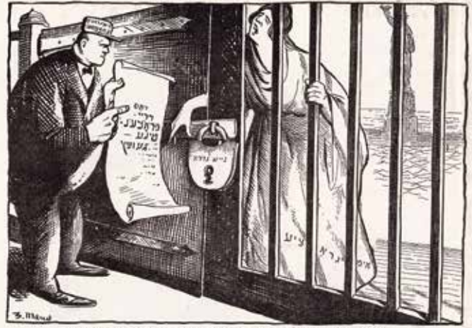
אימיגראציעס-באקאמסער: סעטור ווי דיין פרינעם קען איר דיר נים אויפנאמען.