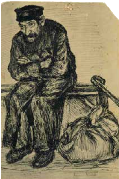
יהודי לאחר פוגרום, גלויה על פי ציור של רגינה מונדלאק, 1920