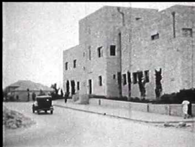
סצנות מתוך הסרט של יצחק פריץ ויילה, 1936. למעלה: קפה וינה, באמצע: ויילה בים המלח, משמאל: בניין המוסדות הלאומיים

היהודיות המודרניות, הוא תיעוד פלורליסטי ומגוון יותר מבחינה אתנית מסרטים אחרים שצולמו באותה תקופה. זהו תיעוד של מבקר חילוני שלא מבקש לצלם או להתמקד ב"מקומות הקדושים" אלא במקומות ממסדיים מודרניים דוגמת הסוכנות העברית וקרן היסוד, באזורי מסחר, בילוי ומגורים, בשווקים ובחגיגות בעיר העתיקה. כוחו של