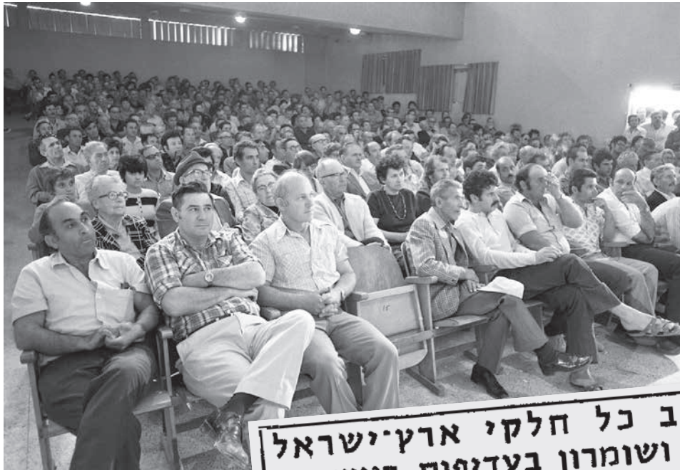
כנס יסוד 'חוג עין ורד', מושב עין ורד, אפריל 1976 למטה: מעריב, 25 באפריל 1976

ניישב כל חלקי ארץ ישראל יהודה ושומרון בעדיפות ראשונה קראו באלף באו כנס עין ורד של „פעילי ההתשובות העוברת למען יהודה ושומרון“