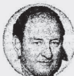
יוסף יחננס: „מכיר נגות: יח סא אוניס, זו רק חודש”

– אמרו חברי משלחת מאנשי ההתישבות העובדת לראש הממשלה ולשר גלילי ✘ „לא באנו להיאבק על דונאם פה ועגבניה שם: נזעקנו כי פיננו קדום פירושו ויתור של יהודה ושומרון” ✘ מי הם ה־11 שהחליטו לארגן ולייצג את „האלפים הרבים בהתישבות שאינם מגיעים לכלל ביטוי” לאחר שלדעתם „נפל דבר בהתישבות”