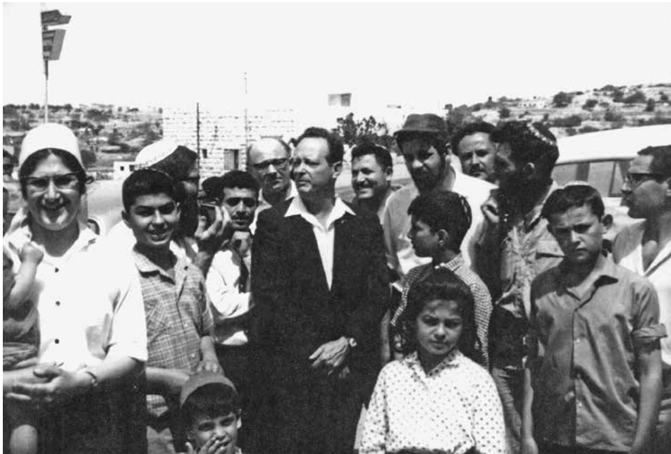
השר יגאל אלון מבקר את מתנחלי חברון, אביב תשכ"ח

'התנועה למען ארץ-ישראל השלמה' רתמה למען מתנחלי חברון את מערכת קשריה ההדוקה עם המנהיגות הפוליטית, הפקידות הממשלתית והפיקוד הצבאי. אנשי התנועה הם שיצרו קשר בין מתנחלי חברון לשר אלון, והוא העניק להם את חסותו. לאחר שנשארו המתנחלים במלון 'פארק' נפגשו אלתרמן ועובד בן-עמי עם שר הביטחון משה דיין, שהתנגד לשהייתם במלון, במטרה למנוע את פינוים, ובפגישה עלה הרעיון להעביר אותם מהמלון למחנה צבאי, וכך אכן נעשה בסופו של דבר. 59 ספק רב אם מיזם ההתנחלות של צעירים מעוטי ניסיון ויכולת כלכלית מ'מרכז הרב' יכול היה לצאת לפועל אלמלא עזרת 'פטרונים' אנשי 'התנועה למען ארץ-ישראל השלמה'. 60 אף לוינגר ראה כך את מערכת היחסים, וכשנשאל על גורל ההתנחלות ענה ש'הוא סומך על התנועה למען א"י השלמה'. 61