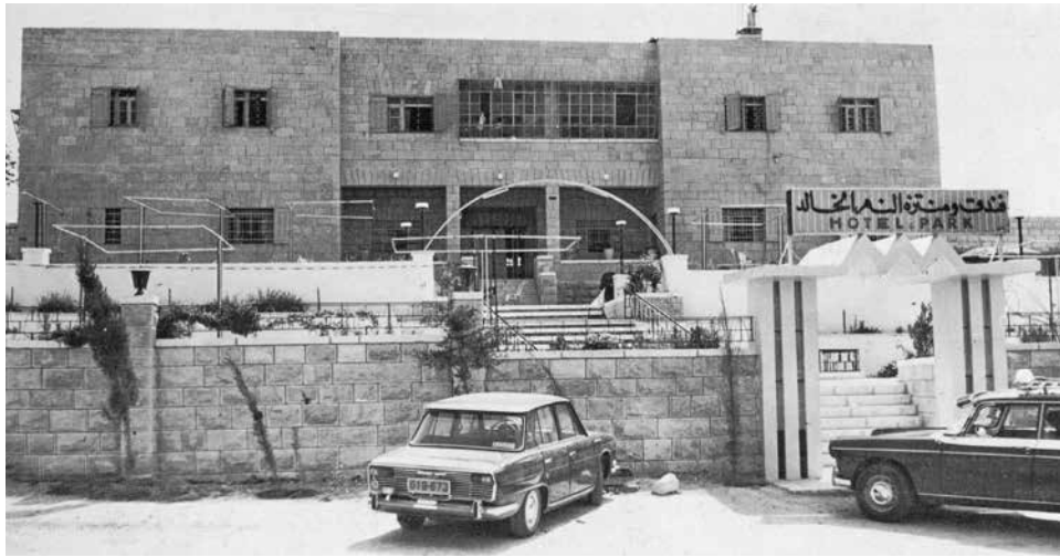
חזית מלון 'פארק', חברון, פסח תשכ"ח