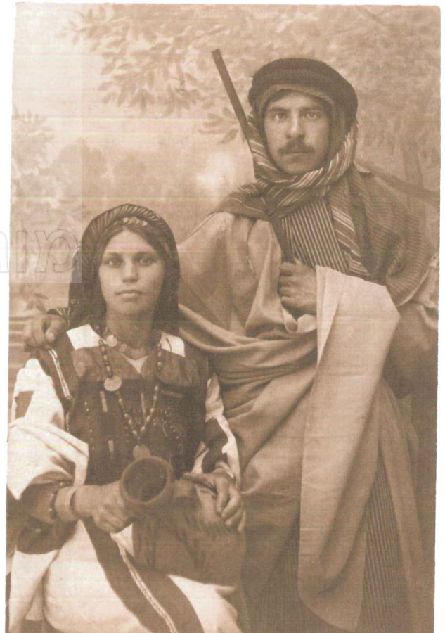
שניים מבני החבורה בלבוש ערבי