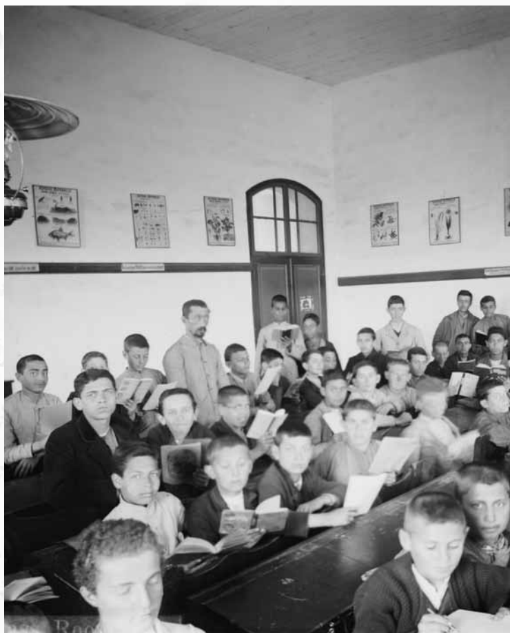
תלמידים בכיתה לימוד בבית הספר