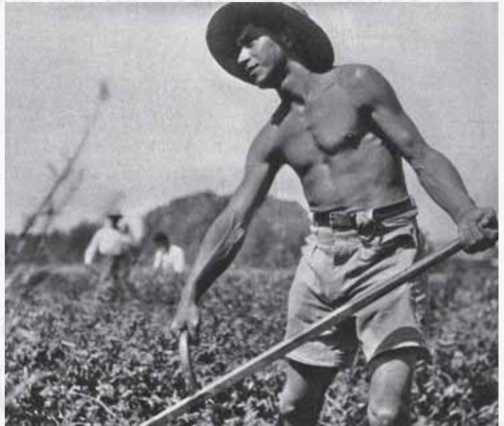
תלמיד עובד בבית הספר 'מקווה-ישראל'

יען כי מכתבי זה ראשון הוא לך על כן הערותי למוטר אונך. אך אתה בני דע כי מוסר [ו]משוש החיים לא נחשבו בעיני לשני הפכים, כי תלמיד אני לחכמי עמי האומרים, 'אין השכינה שורה מתוך עצבות אלא מתוך שמחה של מצוה'; 30 ועתה בני שיש ושמח אך שמחתך תהיה שמחה של מצוה, שפיר[ו]שה ותרגומה האשכנזי הוא 'פראהעס פפליכטבעוואוסטזיין' [נכונות לעשות את החובה בשמחה] ובכן עשה את חובתך ושמח בילדותך, וזכור את אביך זה אוהבך ומברכך ברכת אב ומצפה למכתביך בכליון עינים.