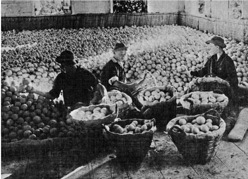
מיון תפוזים בבית הספר 'מקווה ישראל'

ברוך ה' שלום אני בגופי וגם העבודה הוסיפה לי כח. עובר אני כשש שעות ליום וגם את גן הפרחים אשר לנו נעבדהו ונשמרהו. הככר יפה מאד. פה נשקפו לנו הרי אפרים ובמקומות שונות נראה את הים הגדול ואת המושבות יהוד וראשון לציון. גם כפר בית דגון 42 ויעזור 43 יראו פה. רואה אני תמיד את המסלול הולך ושוב מירושלים. ומי יתן ואוכל לראותכם אך פעם אחת. לחג הפסח ולכו רבים מפה ירושלימה ובתוכם אהיה אי"ה גם אני. אמי יקרתי במכתבך שאלתני, אם אפשר למצוא פה עבורך מקום ללון לילה אחד. הדבר הזה אי אפשר כי פה אין אכרים רק שכירים אחדים. אך זאת היא עצתי באי נא ליפו אצל דודי 44 ליום השבת, ואין ספק כי הפקיד יתנני ללכת שם לבקרך.