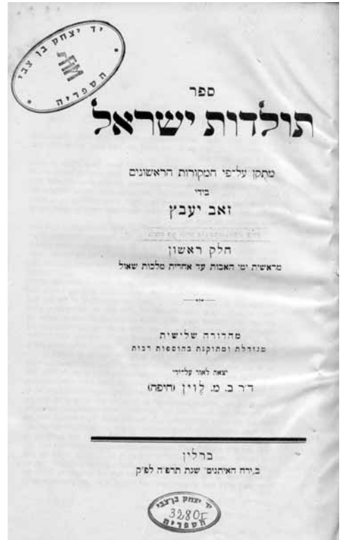
שער ספרו של יעבץ 'תולדות ישראל' (מהדורה שלישית, ברלין תרפ"ה)

בשנותיו הראשונות בארץ-ישראל, 1887-1890, עבד יעבץ כמורה ביהוד ובזיכרון-יעקב. הוא לא הסתפק במנדט שניתן לו ללמד מקרא, תלמוד, לשון עברית ודברי הימים, ושקד על תכנית לימודים חדשה ומפורטת שתתאים למציאות החדשה של יהודים שומרי מצוות ועובדי אדמה בארץ-ישראל. את תכניתו פרש במאמרו 'על דבר החינוך לילדי האיכרים בארץ ישראל', שפרסם בשנת