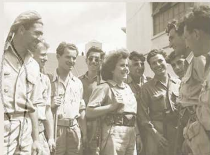
לוחמים ולוחמות ביפו לאחר נביעתה (לעמ')