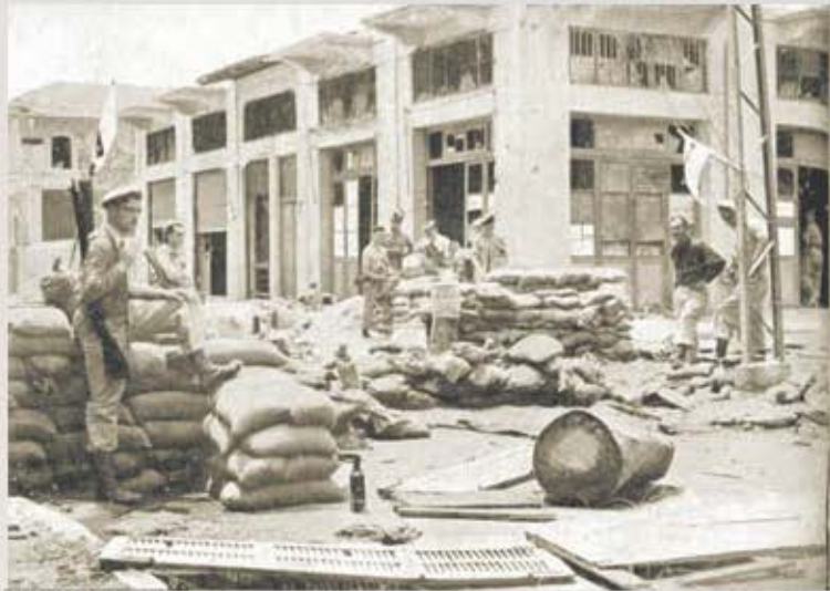
לוחמי הגנה בצר חילים בריטיים בסמוך ליפו לפני נביעתה (לעמ')

לכבוש הכפרים הערביים סביב יפו, מבצע שבמהלכו התברר כי כפרים אלו נטשו מרבם, ולכן לוחמי ההגנה נכנסו אליהם כמעט ללא קרב (פרט להתקפה על תל א-ריוש, שכשלה וגבתה הרוגים רבים). בשלב זה נמצאה יפו מכותרת, ומרבית תושביה – ובהם נכבדי העיר ועשיריה – נמלטו ממנה זה מכבר. לוחמי שגור קריאות מצוקה אל קאוקג'י, מפקד צבא ההצלה, זה שיגר אליה כמה מאות לוחמים. אולם במקום לסיוע לתושבי יפו השתררה אווירת הפקרות בקרב החיילים: הם השתוללו בעיר, בזהו ועשו בה כבשלהם. מנהגי יפו שעדיין נותרו בעיר היו מסוכסכים ביותר, ולא היה במום להנהיג את שארית תושבי העיר. אולם למרבה המזל גם במצואות קשה זו נמצא ביפו מי שיטול לידו את הימיה.