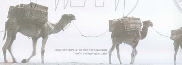
הולו משא חול מריון בת ים - ילום - עתן קולר, 1899, ארץ החוזמים ולחודי

מחויבים או לחוביל את מריון על חקו המסוקן אך ורק על מלטים [1-] אפילו תחנה משלמת כיל רל למסך כל צנת מריון על שם מרדכי קאל מריון וכלל מכוונת. והיה כי שבה אש משגשג לשפת את החוסם חוח - ובאה עולה, מכוונת או כל מרדכת מלטים אחת לשען מר מרדכם, מדעת ככל השנים או שלא מרדכו - חרשת בזוי שאי המעטנים החיים, ככל או מקפתם - לשכח החוסם את יקרו המסוקן מכוון חרדוה, וכל האריות חרדוה כמסרה זה אך ורק על חסר נצמד.