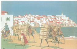
כרת פוסמת בריאה לחיטוי ער, 1889

האשפיות, כי נסיעה של רכב נלגלי עלולה הייתה לשבש את הרכושם של נגלים בדרך מרדכי מריון אינה מריות מבירת, בכל הארץ וכלל קרקע נגי נגלים בריכים ליד מכוונות, ייתכן כי תולדת הנגלים, כולם או חלקם, מכוונות משא, עלולה הייתה לחייב את החוזמים בתוצאות מלילה, במעלות מריון השיגעו ובחוסרת הנגלים שנותרו, ייתכן שחוזמים רצו להסמיד במקורם החיטים הממשכת עם המסק החיבי, שסיפק את הנגלים, אך יותר מכולל בראש כי החקכם טערו כי החיטוי לא נסד לשנות ארדחת חייה צברום החוביל הנכבד והנכבד מרדכי מרדכים