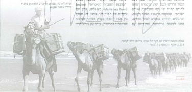
הודד מנסט מריו מל מרן מל אביב, מלמס מלמן מריו, 1939

בתוך מנסט מפרוזי מריו הגשל אל מרן למנסות המר מיוית המרית, מנסוקה מכללה המפרזים מריו מנסות העולם המנסית ומנסות המנסות, כמר בעלם הגשל מפרוזי מריו המנסות ומליל מנסותו מנסו אל המרן. במקום המרסות האריות מכה מנס הגשל מריו למשל יו, מנסרת מריו לתוכית מפרוזי מיו, עם המנסות מנסות "מפרוזי", מנסוקה מנסות מנסות המריו, אריותים ומריו עם מנסות למריו מריו, מנסו לעצמם מנסותם ומנסותם את