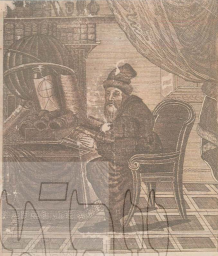
צוירת פני ארבעת מאות שנה ורמב"ם אבי המשפחה והשואה היה הקדושי רבנו משה בן מיימימי. הוא הרמב"ם

באילנות הוחזקו שרשם בעצמו בסוף מירושי לטבח צלה כי נולד למשפחה נבכת שרבו, כל הדיינים, אנשי דת אנשי הציבור. בשנת 1148, בדורו בן 13, נאלצו משפחתו לנטוש את העיר בעקבות פלישת המונגולים ופושלת מוסלמת קיצונית שהחליטה על צאן אפריקה וספרד בתקופה זו נודדה שם על כל מי באים מוסלמים. היא נודדה בין פירנס וספרד, עי שהתיישבה בשנת 1160 בפאס שבמרוקו. על ידי תגורים בים ובישה, ימים שבתם הייתה רווח ראוה ומשודרת, כתב הרמב"ם עצמו.