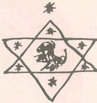
הצעה של הרצל לדגל

במשך דורות רבים שימש המגן-דוד בתור קישוט הן אצל לא יהודים והן אצל יהודים. מגני-דוד חקוקים על אבן נמצאו מתקופות קדומות מאוד כתקופת הברונזה ותקופת הברזל. בתקופות מאוחרות יותר שימש המגן-דוד, אצל היהודים, לעיטור בתי-כנסת קדומים כמו בבית-אלפא וכפר-נחום; אצל הנוצרים שימש לקישוט כנסיות וקתדרלות ואצל המוסלמים - כסמל של כוח קסמים.