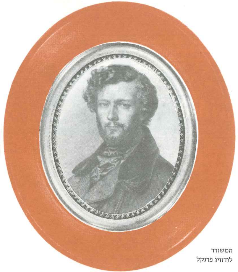
המשורר לודוויג פרנקל