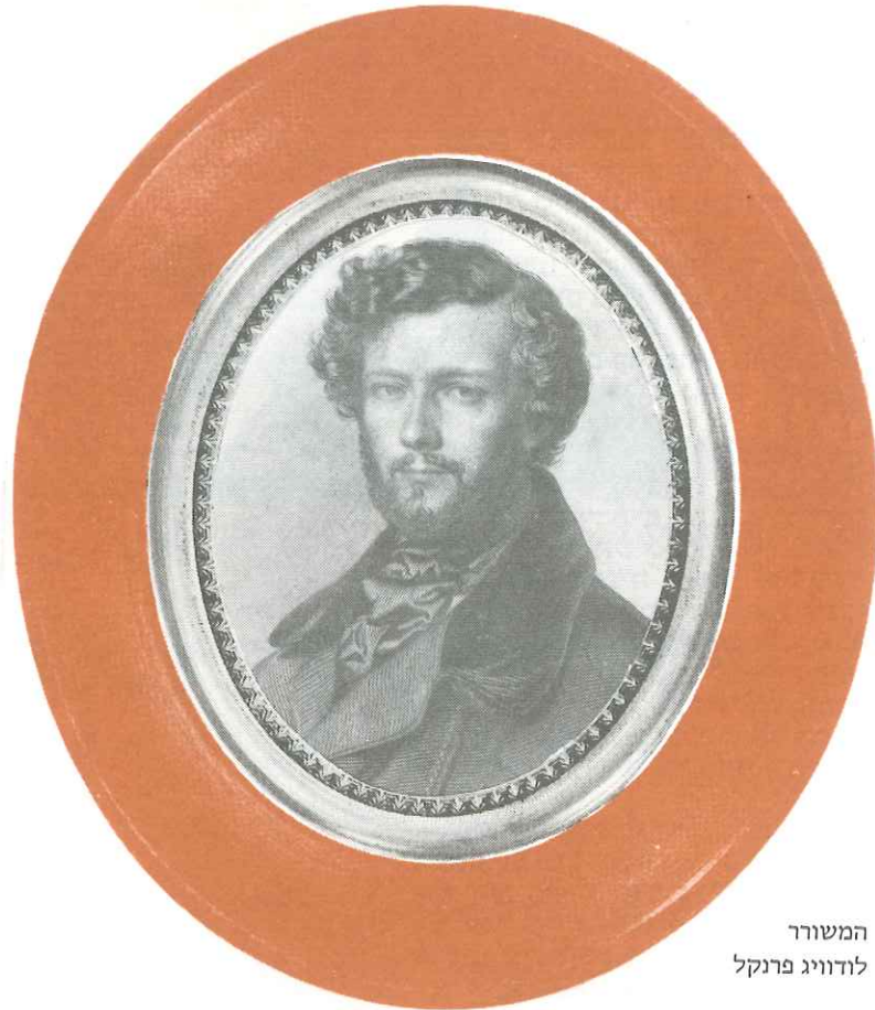
המשורר לודוויג פרנקל