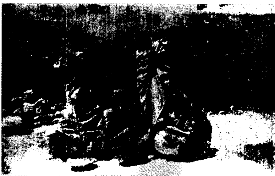
עולים לישראל דרך טוניס מחופשים לערבים

תשושים, רעבים ובמקרים רבים חסרי-כל (אחד המעפילים הראשונים, שפתח את הדרך להעפלה דרך טוניסיה, היה דוד פדלון-פלד, שעבר תלאות רבות תוך כדי העפלתו לארץ). בהוודע ליהודי טוניסיה על העפלה זו, התנדבו רבים לסייע לאחיהם מלוב, דאגו לבטחונם, לאכסונם ולתזונתם במשך כל שהותם בתוניסיה, והסדירו את מעברם בעיקר למרסיי בצרפת, לידי המוסד לעלייה ב' להעלאתם ארצה. יהודי טוניסיה ניצלו גם את קשריהם עם הממשל הצרפתי, בשחרור אותם מעפילים, שנעצרו ע"י משמרות הגבול.