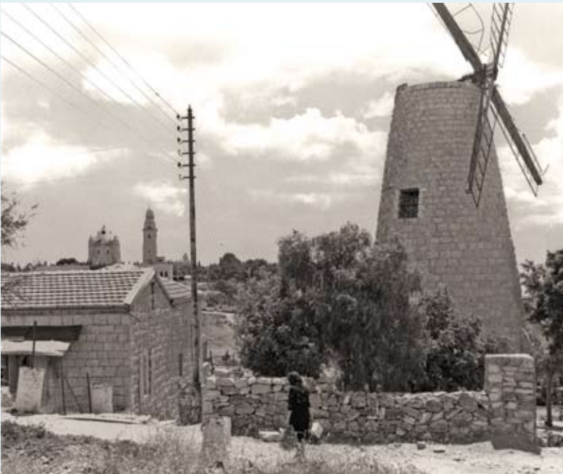
פיצוץ עמדת ההגנה בכיפת הטחנה, 1948