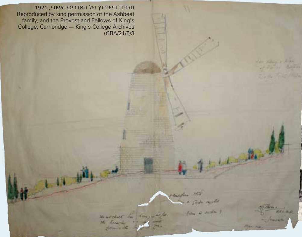
תכנית השיפוץ של האדריכל אשבי, 1921

"סנצ'ו פוסה" לרגלי הטחנה, 1946