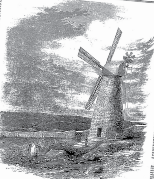
THE FIRST WINDMILL AT JERUSALEM.

WINDMILL AT JERUSALEM. The House of Representatives has resolved to be erected at the foot of Mount Zion, about a quarter of a mile from the Zion Gate, a windmill for the use of the poor who had previously the laborious task of grinding their corn by hand. The mill was constructed and millwright, of Canterbury, under the general superintendence of Mr. F. H. Liddell. Great difficulty was experienced in landing the machinery at the site, owing to the narrowness of the street, and strong winds. The mill is being put up by about forty men. It is intended to be erected on the site of the old mill, which was destroyed in 1848. The mill is to be erected on the site of the old mill, which was destroyed in 1848. The mill is to be erected on the site of the old mill, which was destroyed in 1848.