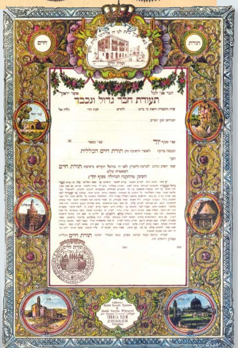
תעודה לתורם מאה דולר ומעלה, ישיבת "תורת חיים" (מוזיאון חצר היישוב הישן)

"החורבה", ומתחתיו כיתוב: "ביה"כ המפואר בית יעקב בחורבת רבי יהודא החסיד ז"ל בירושלים". כתובות דומות של עדת החסידים עוטרו בציור בית הכנסת החסידי "תפארת ישראל". ציורים אלו של שני בתי הכנסת, המופיעים גם בלוחות "מזרח", מעידים על החשיבות שייחסו תושבי ירושלים לבניית בתי הכנסת החדשים בעיר העתיקה. תהליך דומה, של חדירת המבנים החדשים, התרחש גם בסוגים אחרים של תעודות: אחת המפורסמות שבהן היא "שטר צאן ברזל" – מניה בבניין מבנה חדש לישיבת תורת חיים – שנמכרה משנת 1905 ועד סמוך למלחמת העולם הראשונה. בארבע פינות השטר מוצגים ציורים צבעוניים