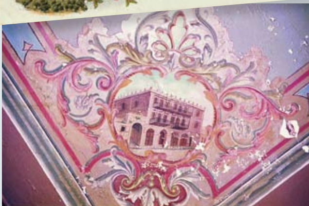
ציור ישיבת "תורת חיים" על תקרתה ברחוב הגיא בעיר העתיקה

"החורבה", ומתחתיו כיתוב: "ביה"כ המפואר בית יעקב בחורבת רבי יהודא החסיד ז"ל בירושלים". כתובות דומות של עדת החסידים עוטרו בציור בית הכנסת החסידי "תפארת ישראל". ציורים אלו של שני בתי הכנסת, המופיעים גם בלוחות "מזרח", מעידים על החשיבות שייחסו תושבי ירושלים לבניית בתי הכנסת החדשים בעיר העתיקה. תהליך דומה, של חדירת המבנים החדשים, התרחש גם בסוגים אחרים של תעודות: אחת המפורסמות שבהן היא "שטר צאן ברזל" – מניה בבניין מבנה חדש לישיבת תורת חיים – שנמכרה משנת 1905 ועד סמוך למלחמת העולם הראשונה. בארבע פינות השטר מוצגים ציורים צבעוניים