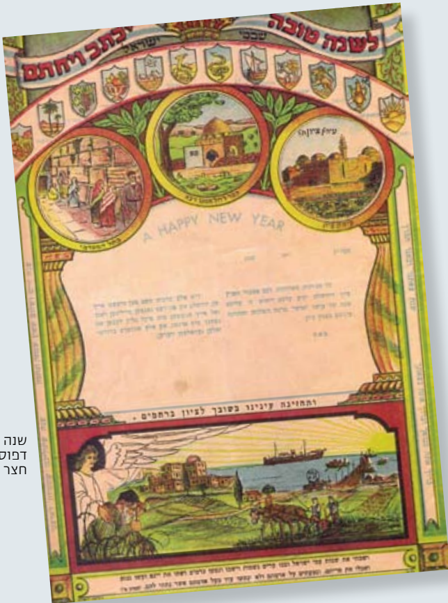
שנה טובה "חלוצית", דפוס אחווה

מסר נוסף בהצמדת הנופים העתיקים לנופים החדשים היה הציפייה המשיחית לגאולת עם ישראל. דוגמה לכך היא ברכת שנה טובה מצוירת וצבעונית מדפוס מנזון, עם ברכה ביידיש, המציגה את המקומות הקדושים כשתחתם ציור נוף ארץ-ישראלי: הרים, עמק, עצי פרי, ובמרכז סל עם ארבעת המינים תוצרת הארץ (ראו עמ' 8). גם במקרה זה המסר ברור: התגשמות החלום היהודי – אולי אף הצינוני? – לחזור לנופי ארץ הקודש מתרחשת כאן ועכשיו, ומסומלת ביבול המבורך של ארבעת המינים, המסמלים את החזון הנבואי לברכות רוחניות וגשמיות בארץ ישראל. פן אחר של הנוף הארץ-ישראלי המתחדש משתקף בברכת שנה טובה מצוירת וצבעונית מדפוס אחווה בירושלים, ככל הנראה מתקופת מלחמת העולם השנייה. בחלקה העליון של הברכה מצוירים בציור סטנדרטי למדי סמלי שנים עשר השבטים, ציון, קבר רחל והכותל המערבי; אך בחלק התחתון מצוירים נמל תל אביב עם ספינה ומעפילים, חלוצים בשדה, מבנים חדשים, והמלאך (אליהו הנביא?) השולח את יהודי הגולה לארץ ישראל. הציטוטים מן