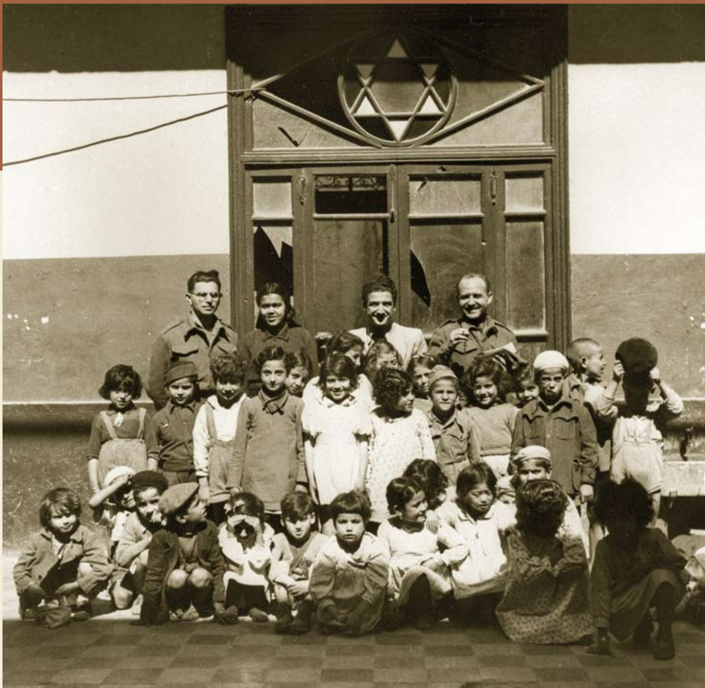
חיילים ארץ־ישראלים ותלמידי בית הספר העברי, בנגאזי, לוב 1944

ד"ר חיים סעדון , העורך המדעי של סדרת הספרים "קהילות ישראל במזרח התשע־עשרה והעשרים", מכון בן־צבי לחקר קהילות ישראל המזרח.