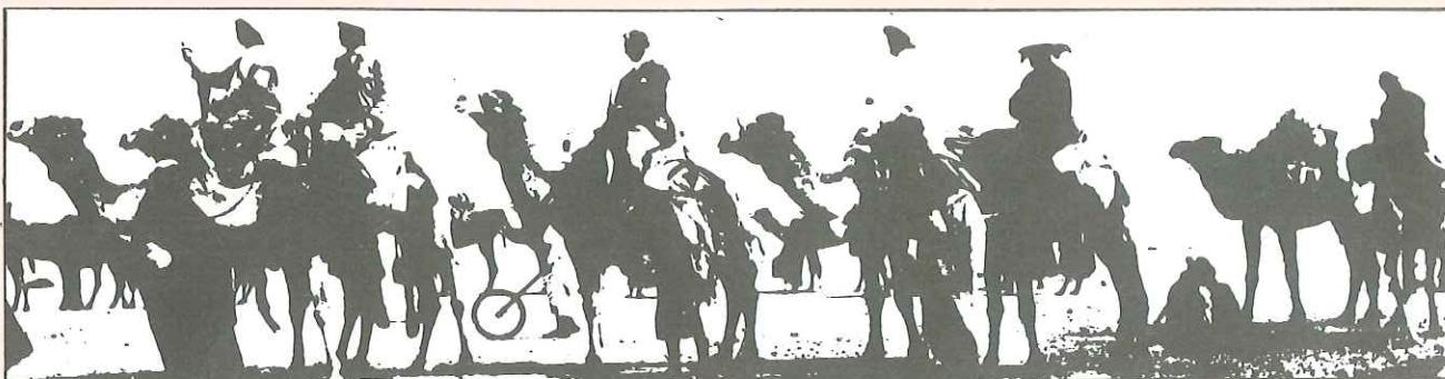
המשלחת יוצאת לדרך