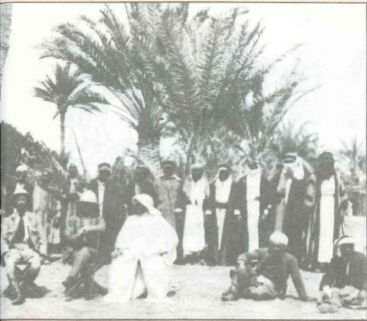
חברי המשלחת במדבר עם ראשי שבטים בדואים