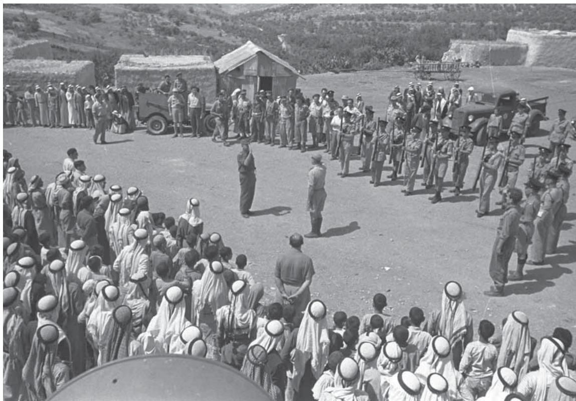
כניסת הממשל הצבאי לאום-אלפחם (למעלה), וחתימתו של אחד מנכבדי הכפר על הכרה בשלטון החדש, מאי 1949