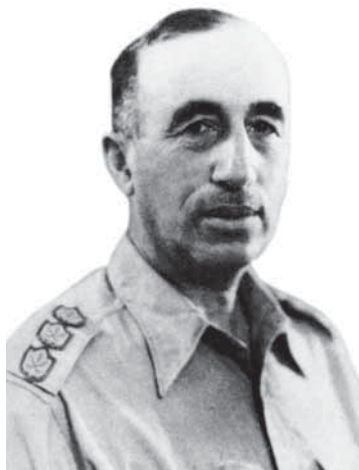
האלוף יוחנן רטנר

הנימוקים הביטחוניים שחייבו את כינון הממשל הצבאי, את ההגבלות שהטיל ואת קיומו במשך שמונה-עשרה שנים, נבעו מתפיסה שזיהתה את הרחבת ההתיישבות היהודית עם צורכי הביטחון. על רקע ההתנגדות העזה מצד מפלגות ימין ושמאל לממשל הצבאי נדונה מחדש מדי כמה שנים השאלה אם להמשיך ולקיימו, אך בכל פעם שבה והכריעה התפיסה שהממשל הצבאי נחוץ כדי לקדם את האינטרס הביטחוני של חזיון ההתיישבות היהודית בארץ. 14 ברוח ועדת רטנר, אשר מונתה בדצמבר 1955 לבדוק את האפשרות לצמצם את שטחי הממשל הצבאי ואת היקף פעולתו, נקבע חד-משמעית כי אין לבטל את הממשל הצבאי ואין לגרוע ממעמדו או מסמכויותיו. שניים מתוך ארבעת תפקידיו העיקריים, צוין ברוח ועדת רטנר, הם חזיון ההתיישבות ותמיכה ביישובי העולים. כאן נוצר הזיהוי של האינטרסים של ההתיישבות בתחומי המדינה עם המנגנון הצבאי. כאן נוצר הזיהוי של האינטרסים של ההתיישבות עם הגנה על היהודים מפני הערבים, בין אם מדובר היה בפיקוח פוליטי ובין אם מדובר היה בהבטחת הבעלות היהודית על אדמות. על פי דוח