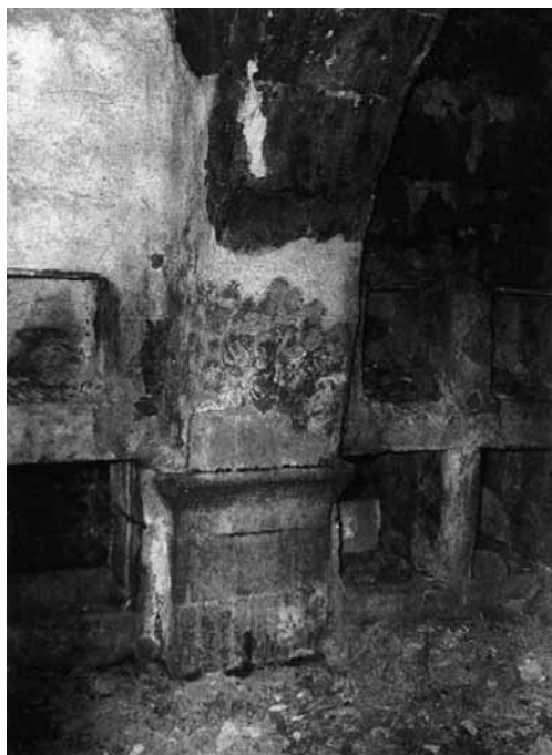
מתוך שפע התצלומים והתרשימים בספר: תרשים איזומטרי (מעשה ידי לי ריטמאייר) ותצלומים מפנים הבניין המשורטט