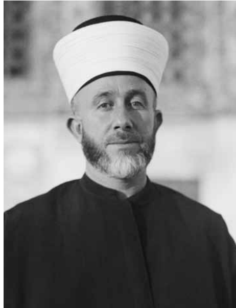
חאג' אמין אלחסיני (1929)

ספרו של כבהא, המביא באופן מתומצת, בהיר ומבוסס את סיפורו רב התהפוכות והקשה של העם הפלסטיני לאורך יותר ממאה שנים, בוודאי ישמש רבות ורבים שיבקשו ללמוד באופן מוסמך ושקול את תולדותיו. הספר אף יאפשר למעיינים בו לחוות באופן בלתי אמצעי את ההיסטוריה הפלסטינית מנקודת המבט של הערבים הפלסטינים עצמם. יש לקוות שבכך ייפתח שער להבנה הדדית טובה יותר, שתוליך לקירוב העמים ולפיוס.