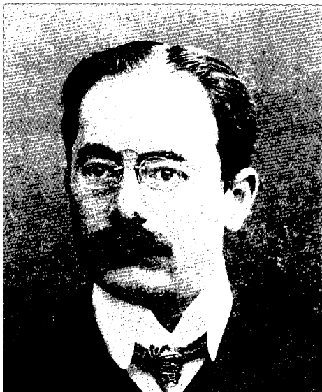
ארתור רופין 1876-1944

כדי להשתחרר מהתפיסה של המחבר, הרואה בבן־גוריון את הגרוע שבין המנהיגים הציונים, כלומר כמי שגרם יותר מכל מנהיג ציוני אחר להתהוות הסכסוך הציוני־הערבי, יש להשוותו למנהיגים אחרים, ובראש ובראשונה ציונים,