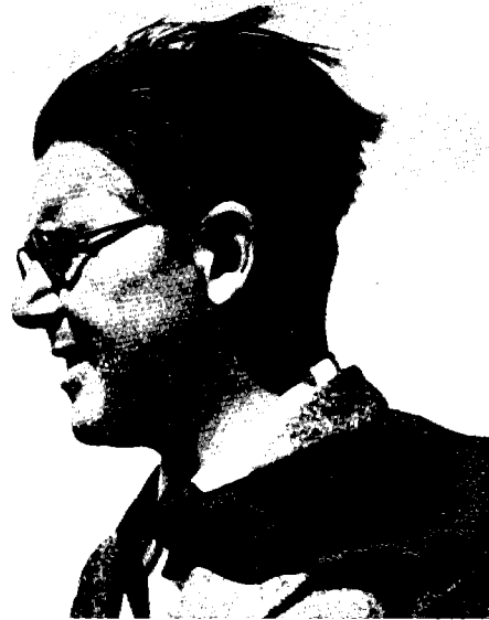
ריצ'רד הורד סטפורד קרוסמן 1974-1907

עליה עם ריצ'רד קרוסמן, חבר הוועדה, ב־20 במרס. 14 בצדק התייחסה ההנהגה הציונית בכובד ראש לוועדה האנגלו-אמריקנית - הייתה זו ועדת חקירה ראשונה לארץ-ישראל שחבריה לא היו רק בריטים. המדינה היהודית במפה זו כוללת