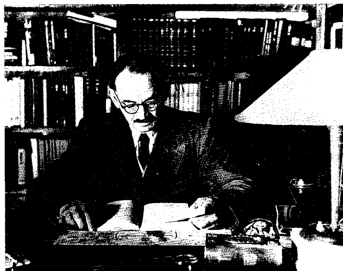
יוסף ויץ 1890-1972

על מנת לדכא את המרד הערבי לא מטעמים ציוניים אלא מטעמי יוקרתה של האימפריה הבריטית המאוימת על ידי מעצמות ה'ציר'. לא הרי מעמדה האימפריאלי והבין-לאומי של בריטניה לפני המלחמה כהרי זה שלאחריה. אם