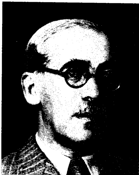
יצחק וילקנסקי אלעזרי-וולקני 1955-1880