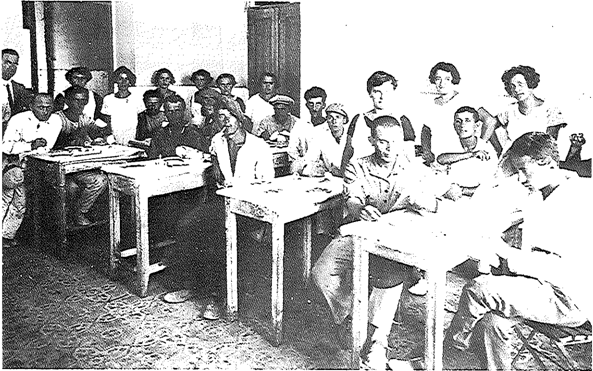
מטבח פועלים בחיפה, 1923

לתת טעם ומשמעות לחייהם, מעין דרגש לעמוד עליו ולהתבונן אל מעבר לאופק האפור.