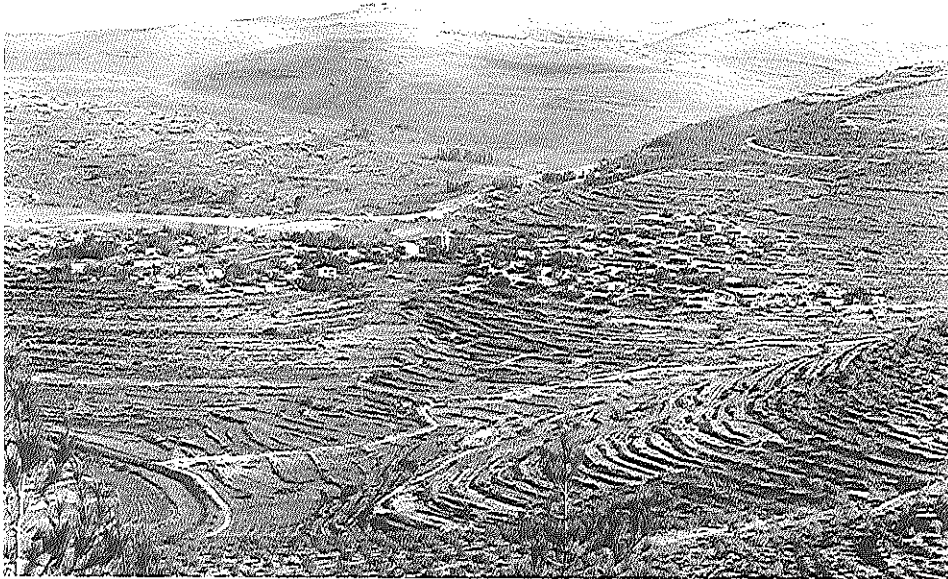
המדרגות בהרי ירושלים – מאימת?

באותם ימים התקדמה הכלכלה בארץ שבעת המינים (דברים ה, ח) ושבעת גוני הצבעים (שמות כו, לא; משנה, שביעית ז, ב; תוספתא, שבת ט, ז); השתכלל המסחר הלאומי והביין-לאומי בשמן וביין, בסוסים ובמרכבות ביהודה ובישראל, 3 והתפתח המסחר במותרות – בקטורת ובבשמים, בזהב ובאבני הן – ביבשה – ב'דרך הבשמים' וב'דרך המלך', בים התיכון – ב'ים יפו' ובים סוף – ב'עציון גבר'; הונחו היסודות למלאכה ולהרושת בכל תבלי הארץ, בזכות השימוש הנרחב בברזל, שהופק מהבל גחל יבוק שבגלעד, ובנחושת, שנחצבה בערבה (מלכים א ז, יד); השתכללו הבנייה והביצור באבן בסיוע כלי המתכת – שלמה, הבנאי הגדול של יהודה (ובעקבותיו אחאב, שיוז מפעלי בנייה גדולים בישראל), בנה את ירושלים הבירה ואת