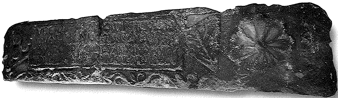
המשקוף במבט מעל

האזניים חסר עיטור האמור להשלים באופן סימטרי את עיטור הוורדה הקיים מימין לה. שבר נוסף זה, השלישי, טרם אותר. בשלב זה של מחקר האבן אין יודעים אם מקורה בבניין ציבורי שעמד בתחום היישוב העתיק מע'אר (מעריה היהודית מתקופת התלמוד?) 12 או שמא בבניין באתר אחר מחוץ לתחומי הכפר. מכל מקום מפתיע הוא שהאבן טרם נודעה לציבור החוקרים אף על פי שהיא מוגנת בכפר זה עשרות בשנים. נראה שבמע'אר צפונים שרידים רבים נוספים, והיא עשויה להפתיע אותנו גם בעתיד.