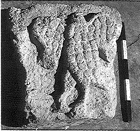
אבן גיר מעוטרת בנשר שנתגלתה במע'אר

לעת עתה בין שני היישובים. בשניהם נמצאו בעבר פריטים ארכיטקטוניים שמקורם כנראה בבתי כנסת עתיקים. במע'אר הדרומית נתגלה בעבר בשכונה המזרחית פריט מאבן גיר עם עיטור בתבליט של גשר, ובגרעין הכפר ובשכונה המערבית הגובלת בו הבחנו בעבר באבני גזית גדולות ובפריטים אדריכליים אחדים נוספים. 6