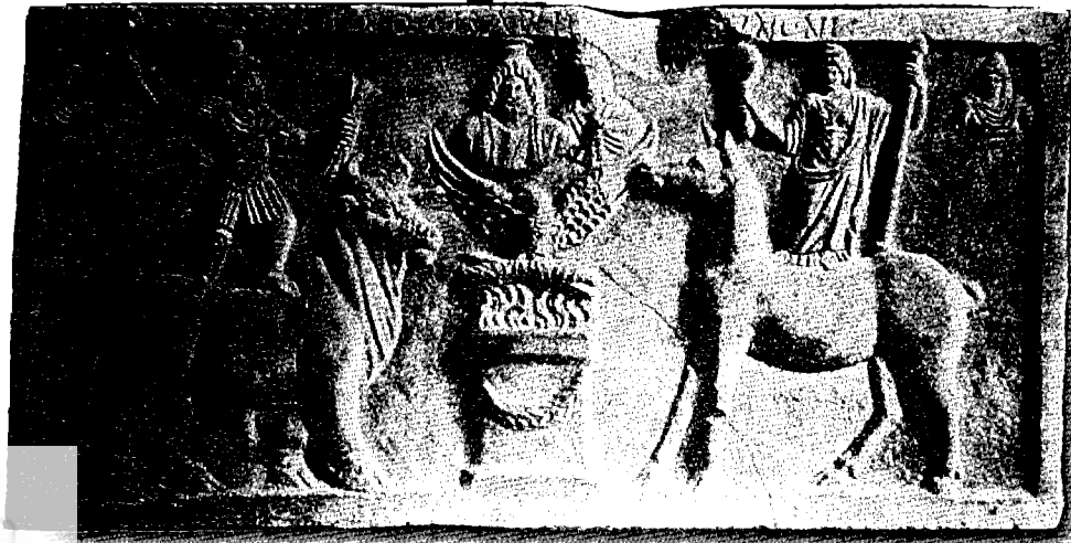
תבליט שנמצא ברומא. בצד שמאל ניצב יופיטר דוליכנוס על גבי שור ובימינו קרדום כפול

על סוס ומחזיק בקרדום כפול. כך למשל במצבה משנת 100 לספירה שנחשפה בעיר הייראפוליס שבפריגיה מתואר קרדום כסוף בצרוף כתובת הקדשה לאפולו. 26 יתר על כן, בכנסייה של העיר סבסטי שבפריגיה הידועה היום בשם Selcukler נתגלתה מצבה מן התקופה הרומית שהוקדשה להליוס