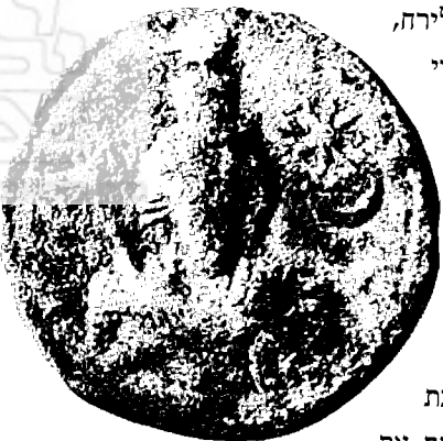
אסימון (אישור כניסה למשנתה אלילי) שנמצא בפלמירה