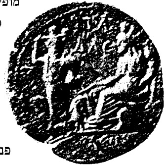
מטבע שמקורו בגבלה, פניקיה, מן המאה השנייה לספירה

על מטבע מימיו של קומודוס (180-192 לספירה) שמקורו ביישוב עירוני קטן בשם גבלה/גבלא, השוכן על חוף סוריה בין ארדוס (רואד של היום) לבין לאודיקיאה-מריטימה (לטקיה של היום), מופיע אליל בעל זקן המחזיק בקרדוס הכפול ובמגן ועומד בין שתי פרוטומות של סוסים. 42 סיריג סבר כי דמות אלילית זו מייצגת אלוהות אנטולית-סורית שמקורה בצפון סוריה ושבתיקופה הרומית הגיעה גם לחופי פניקיה, ודמות זו מקבילה להליוס, אל השמש היווני. 43 סיריג טען כי זאוס, טיכי והליוס היו השלישייה האלילית המובילה בעיר זו מן התקופה ההלניסטית ועד התקופה הרומית. 44 קביעתו של סיריג מבוססת על העובדה שבמטבעות העיר מן התקופה ההלניסטית מופיעה בבירור דמותו הקלסית של הליוס היווני. 45 דבר זה תמוה הואיל ובמטבעות ערי פניקיה מן התקופה הסלווקית כמעט אין ייצוג לדמותו של אל השמש היווני, להוציא מטבעות אחדים מן הערים השכנות לגבלה, כגון: ארדוס, לאודיקיאה-מריטימה. 46 מכאן הסיק סיריג כי הופעתו של הליוס היווני בממצא הנומיסמטי האזורי איננה תוצאה של המדיניות הדתית