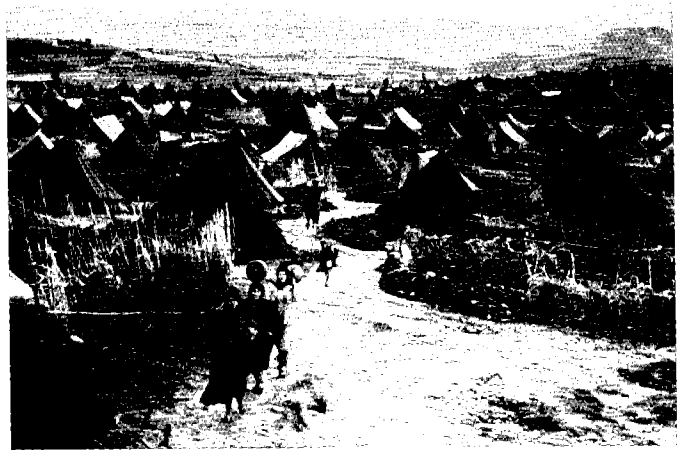
מחנה פליטים בנהר אלבארד שבלבנון בשנה הראשונה לקיומו

המחבר חותם את הדיון במה שהוא מכנה ה'היעלמות' וה'הופעה מחדש' של הזהות הפלסטינית. התקופה שבין שתי נקודות ציון אלה, בין 1948 ל-1964, מכונה בהיסטוריוגרפיה הפלסטינית 'השנים האבודות', אולם לדברי