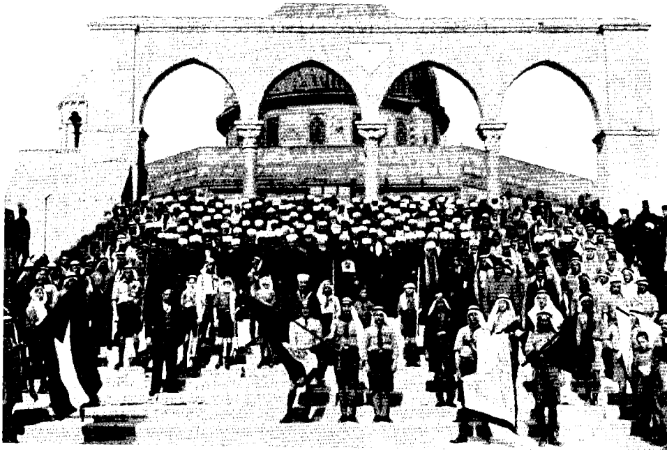
ירושלים כמוקד למאבק – מחאה על רקע כיפת הסלע נגד מכירת אדמות ליהודים שאורגנה בידי המופתי הירושלמי חאג' אמין אלחסיני, 1935

טיוון מעניין נוסף בספר הוא כי הזהות הפלסטינית נתפסה בתודעה הציבורית כדבר חדש, תוצר של התקופה האחרונה (בהקשר זה המתבר מזכיר מספר פעמים את התבטאותה