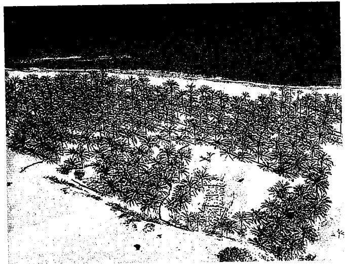
'דרך ארץ פלישתים' (שמות יג), חוף הים התיכון מצפון למצרים - תצלום מתוך ספרו של הראל

ומאפשרת לנו להתוודע אל מבנה החברה, מגוון נושאי התרבות וקווי המדיניות שהיו מקובלים בעבר. נתונה הם ארכאולוגיים והיסטוריים, גישתה היא גאוגרפית-מרחבית, ואילו הכלים המשלימים הם המקרא, הספרות הקדומה, מסמכים מן העבר ומעל לכול - ההכרה הבלתי אמצעית של השטח. אמנם אין הסכמה מוחלטת בין המדענים העוסקים בגאוגרפיה היסטורית באשר לגבול שבין גאוגרפיה להיסטוריה, ובשאלה באיזו מידה השפיע ממד המרחב על