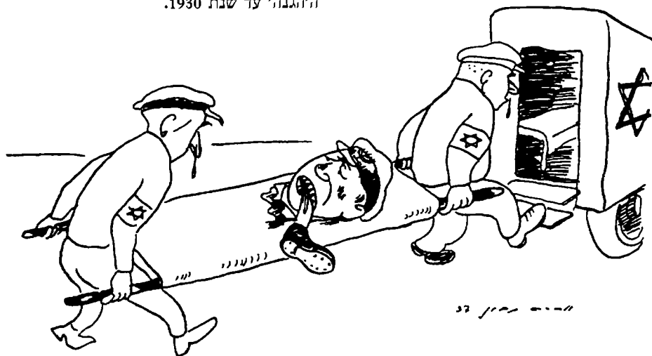
בית"ר "אכל את עצמו" על שהוכרח לשבות השנה באחד במאי