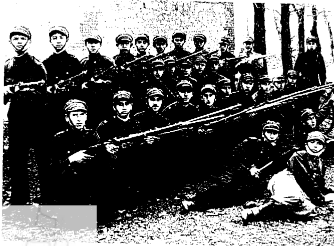
חניכי בית הספר לסגני מפקדים של בית"ר בלובלין, פברואר 1933

ח חשוב לציין לא רק מה יש בספר אלא גם מה חסר בו או חסרה התייחסות ראויה אליו, ואמנה רק שני עניינים. אין להתעלם כמובן מהקושי האובייקטיבי של מחברת הספר: בכל מונוגרפיה קיים הצורך לקבוע גבולות לסיפור העלילה.