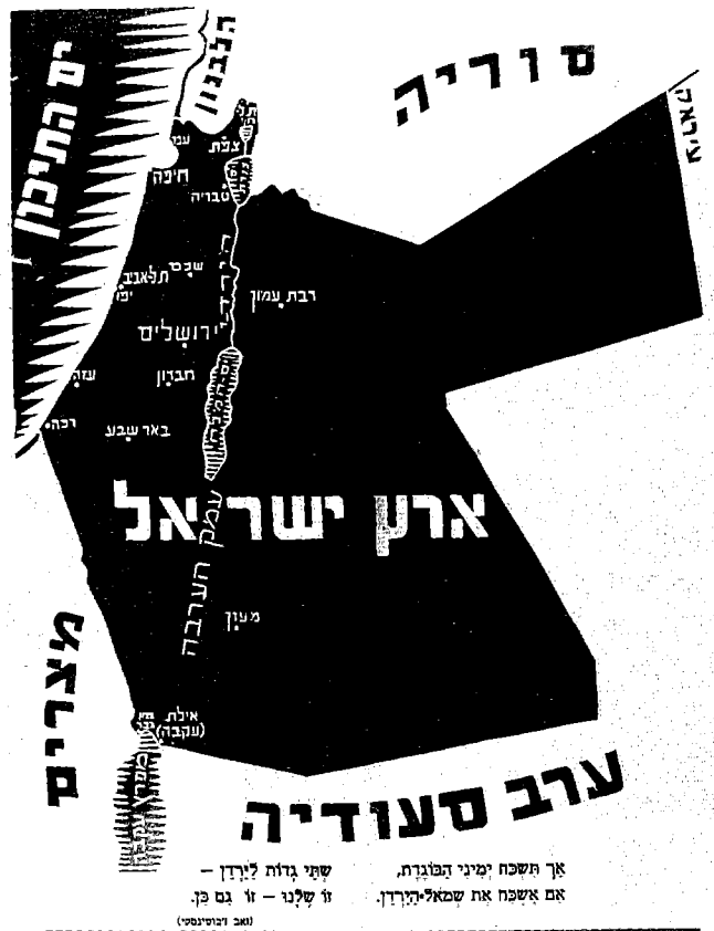
ההסתדרות הציונית החדשה סדרן תל-יחי

לדעתו נחתי את הארץ הזאת מנהר מצרים עד הנהר הגדול נהר פרת