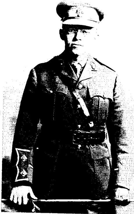
זאב ז'בוטינסקי כקצין בגדוד העברי, 1919