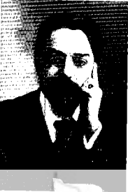
למעלה: שר המושבות הלורד פספילד מימין: עמנוך השער של דוח הוֹפ-סימפסון לממשלה