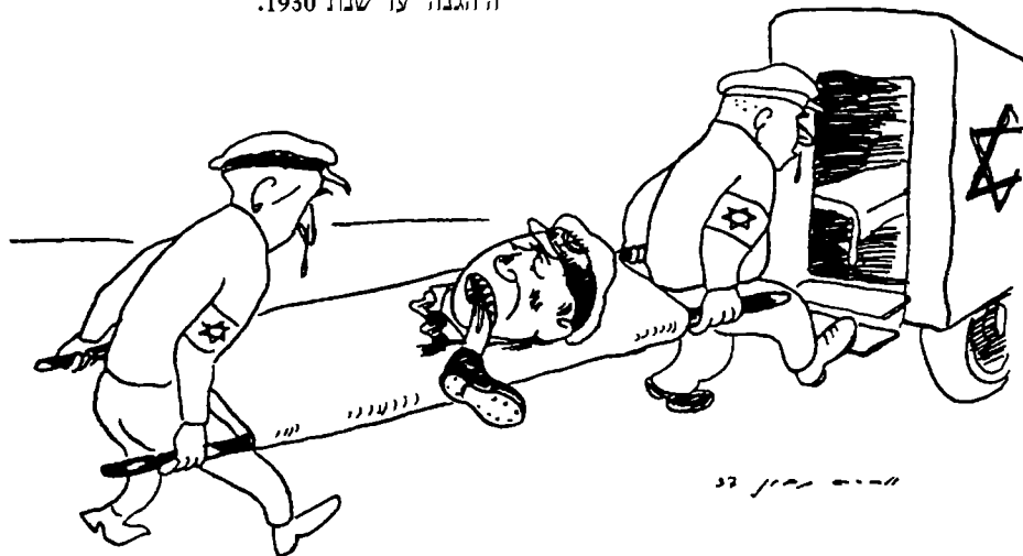
בית"ר "אכל את עצמו" על שהוכרח לשבות השנה באחד במאי