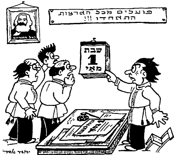
אסון' חברים! נצטרך לשבות בשבת!...

שה'הגנה' הייתה ארגון ביטחוני מחתרתי סקטוריאלי ששירת רק את האינטרסים של חלק מהעם, קרי מעמד הפועלים, ושז'בוטינסקי שלל את ה'הגנה' בגלל היותה סקטוריאלית. שתי הנחות פוטנציאליות אלה מוטעות וחשוב להעמיד את הדברים על דיוקם.