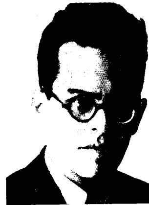
מימין לשמאל: אבא אחימאיר, אורי צבי גרינברג, יהושע השל ייבין

חלק מתנועת העבודה שדגל בסוציאליזם ובמלחמת המעמדות, כגון 'פועלי ציון' ואחדות העבודה' בשנות העשרים. ובוודאי נכון הדבר למפלגת 'הפועל הצעיר' האנטי-סוציאליסטית, ששללה גם את הרעיון של מלחמת מעמדות. מפא"י, שנוסדה בשנת 1930 כפרי האיחוד בין מפלגת 'אחדות העבודה' ובין 'הפועל הצעיר', ועל ידי כך הגיעה להגמוניה בהסתדרות העובדים הכללית, ביישוב ובתנועה הציונית, החזיקה אמנם באידאולוגיה המעמדית והשתמשה ברטוריקה סוציאליסטית, אבל גם היא נתנה בכורה מוחלטת לאינטרס הלאומי. מדיניות זו הדריכה אותה לאורך כל שנות קיומה. נתון זה מסביר בין השאר את המדיניות המרסנת של הסתדרות העובדים הכללית בכל הקשור למאבקים מקצועיים ולשבתות. לכן אני מתקשה לקבל את הצעתה