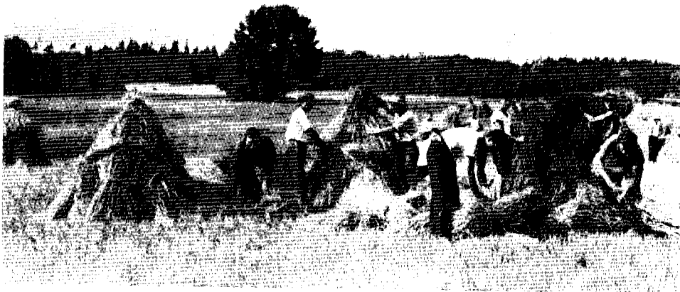
'חוות סטוקי' להכשרה חקלאית, לטווייה 1925

צריך להדגיש כי בשנים הראשונות לאחר ייסודו של הצה"ר בשנת 1925 בפריו לא בלטו עדיין הניגודים הפוליטיים והסוציו-כלכליים בין ז'בוטינסקי ותנועתו לבין תנועת העבודה הארץ-