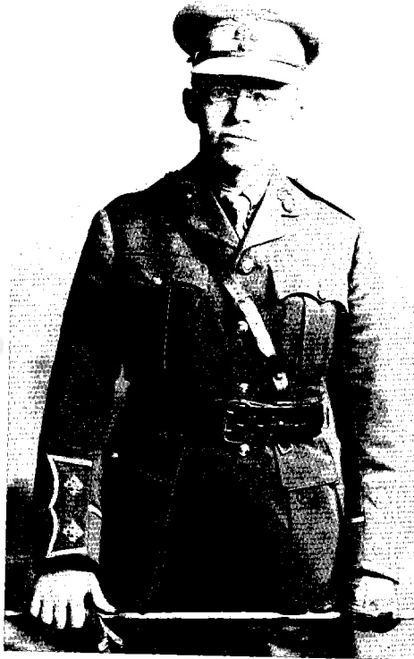
זאב ז'בוטינסקי כקצין בגדוד העברי, 1919