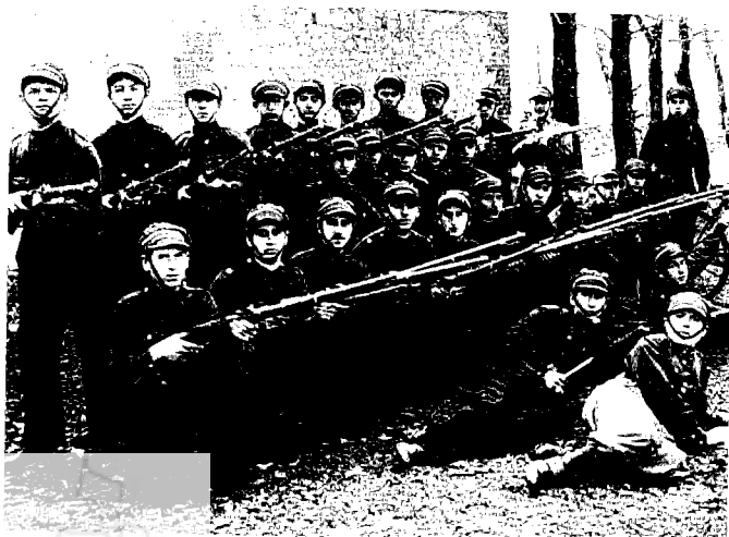
חניכי בית הספר לסגני מודריכים של בית"ר בלובלין, פברואר 1933

ח חשוב לציין לא רק מה יש בספר אלא גם מה חסר בו או חסרה התייחסות ראויה אליו, ואמנה רק שני עניינים. אין להתעלם כמובן מהקושי האובייקטיבי של מחברת הספר: בכל מונוגרפיה קיים הצורך לקבוע גבולות לסיפור העלילה.