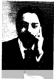
למעלה: שר המושבות הלורד פספילד מימין: עמנוך השער של דוח הוֹפ-סימפסון לממשלה