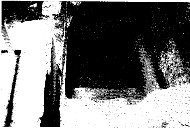
מקווה שאינו ראוי לטבילת אדם בבית המידות ברובע ההרודייני

פורסמה בשנת תש"ל ואשר לא היו לה מהלכים לאחר מכן, שהמקוואות הוכשרו על ידי הוספת מים למקווה כשר וגלישתם למקווה ריק, וכדברי המשנה, 'היה בעליון ארבעים סאה ובתחתון אין כלום ממלא בכתף ונותן לתוכו עד שירדו לתחתון ארבעים סאה'. 3