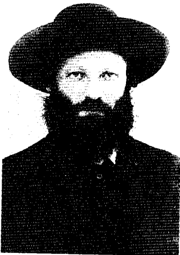
הרב אברהם יצחק הכהן קוק (1865-1935)

עסקנים תנועתיים בעלי מחשבה, ואחדים מהם פובליציסטים בעלי הגות - הן מבחינת מקוריות הדיון והן מבחינת מידת השפעתם. ישעיהו ליבוביץ שונה אמנם מכל ההוגים הללו בדרך