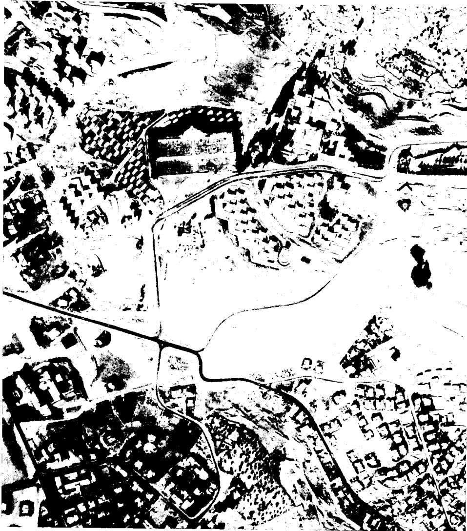
צלב בית הקברות ומגן דוד בכפיפה אחת (תצלום אוויר משנת 1973)

שביקש כביכול להצניע את הצלב, עשה את ההיפך מכך והטיל על ירושלים צלב ענק. אילו לא הסתפק פוקס בתיאור גוף העיר ואתריה הקדושים הנשקפים מהר הצופים מבעד ל'צלב ההקרבה', אלא היה מביט מהעיר אל הר הצופים, במבט מגבוה, היה מגלה שהשבילים אינם כה תמימים - הם מהווים צלב ענק המרחף מעל עיר הקודש. מהעיר אין רואים את 'צלב ההקרבה', גם