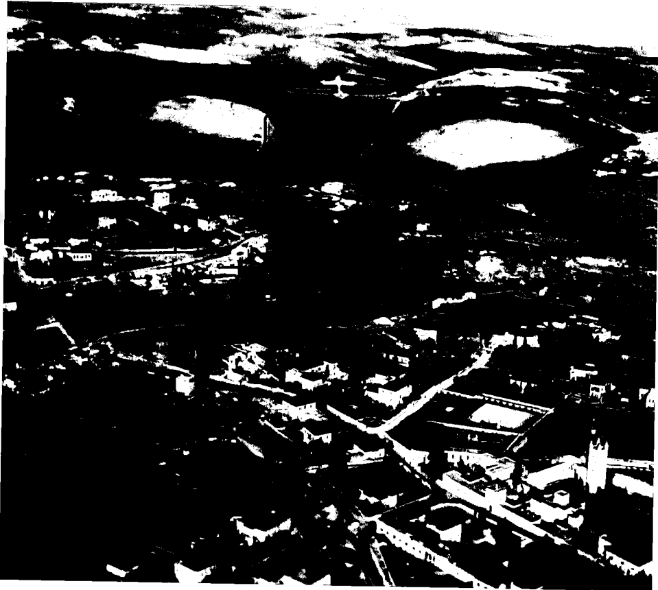
צלב בית-הקברות בהר הצופים (הצלום אוויר משנת 1934), מבט ממערב

1 P.B. Shelley, Adonis , Oxford 1891, pp. 69-70