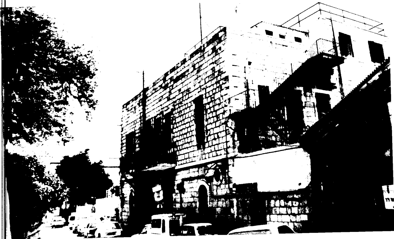
הבית שנבנה על-ידי 'אגודת ירושלים השוודית' בשנת 1928 ושימש את בית הספר של האגודה עד שנת 1948 (היום ברח' עידו הנביא 8)

סטיין, מנהלו הראשון, לא היה מרוצה מהתפקיד ומהחיים הקשים יחסית בירושלים, ובשנת 1903, פחות משנה אחרי בואו לארץ, החליט לחזור לשוודיה. עד להגעת מחליף מתאים (שש שנים מאוחר יותר) מילאה את מקומו מרתה קלאר (Klaer), אחות דיאקוניסית מבית הספר לבנות 'שליטא קומי'. 16 רוב התלמידים בבית-הספר היו ילדים ערבים-נוצרים מבני העדה היוונית-אורתודוקסית, ולכן גם שפת הלימוד היתה ערבית; 17 מוסלמים ויהודים לא שלחו בדרך כלל את ילדיהם לבית-ספר זה (מאותם נימוקים שלא שלחו את ילדיהם למוסדות מיסיונריים אחרים).