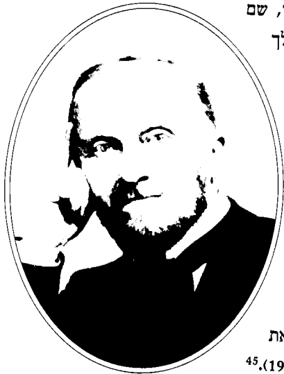
גוסטב דלמן (1855-1941)