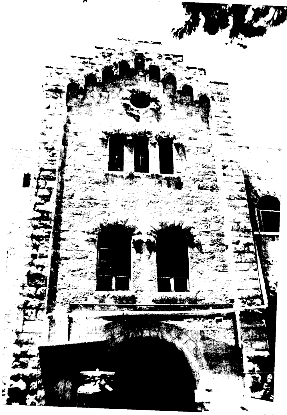
הקטע שנותר מן החזית המזרחית של בניין בית-החולים בבית-ג'לא. נחנך בשנת 1922