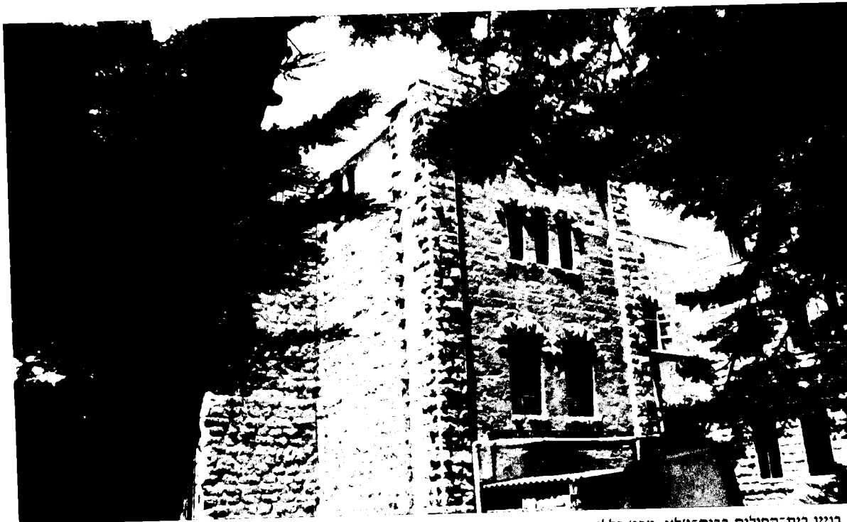
בניין בית־החולים בבית־ג'לא, מבט כללי

לשם כך הוגשה לשלטונות העות'מאניים בקשה לרכישת חלקת קרקע הסמוכה לביתה של משפחת ריבינג (להגשמת מטרה זו פעל גם הקונסול השוודי בירושלים גוסטב דלמן). בשבעה בחודש מוחרם 1329 להג'רה (29 בינואר 1909) נתקבל האישור המיוחד לרכישת הקרקע. 26 באותה עת הוחל בגיוס כספים מקיף בקרב חברי האגודה בשוודיה, וארבע שנים מאוחר יותר, ב־6 בנובמבר 1913, הונחה אבן הפינה לבית־החולים בנוכחות מושל ירושלים התורכי, הקונסול השוודי, נכבדים משוודיה ונכבדים מן האזור. 27 סמוך מאוד לתחילת הבנייה פרצה מלחמת העולם הראשונה ובשל כך חלו עיכובים בהעברת הכספים ובבנייה, והבניין החדש נחנך על כן רק אחרי המלחמה, בשנת 1922. למרות תוספות הבנייה הרבות הניכרות בבניין בית־החולים, ניתן עדיין לזהות היום חלקים מן הבניין המקורי. 'אגודת ירושלים השוודית' המשיכה לנהל את בית־החולים עד שנת 1957, ובשנה זו הועבר הניהול לידי השלטונות הירדניים. לאחרונה, עם העברת הסמכויות בנושאי בריאות וחינוך בגדה המערבית מישראל לרשות הפלסטינית, עברו גם בית־החולים ובית־הספר בבית־ג'לא לפיקוחה של רשות זו. כיום מסתכמת המעורבות השוודית בשני מוסדות אלה בהעברת מענק תמיכה שנתי המורכב מתרומות חברי האגודה בשוודיה. מענק זה מהווה רק חלק קטן מתקציבם השנתי של מוסדות אלה. 28