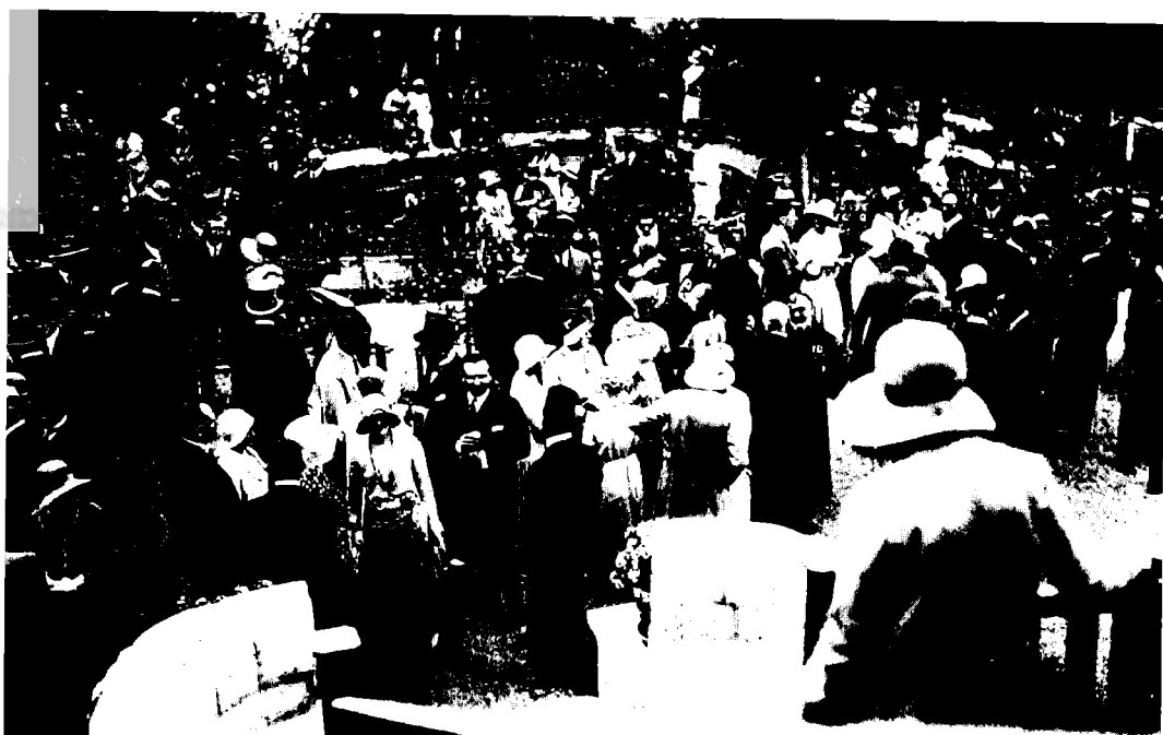
חגיגות יום-ההולדת של המלך ג'ורג' החמישי, בית הממשל, ירושלים (3 ביוני 1930)