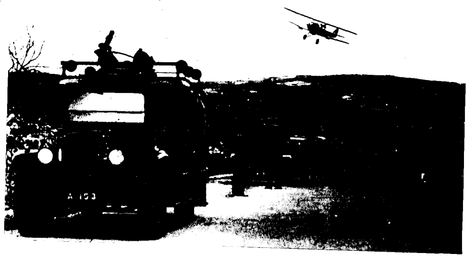
חיילי הרגימנט הבריטי Black Watch במהלך חיפוש בהרי חברון (13 בינואר 1938)