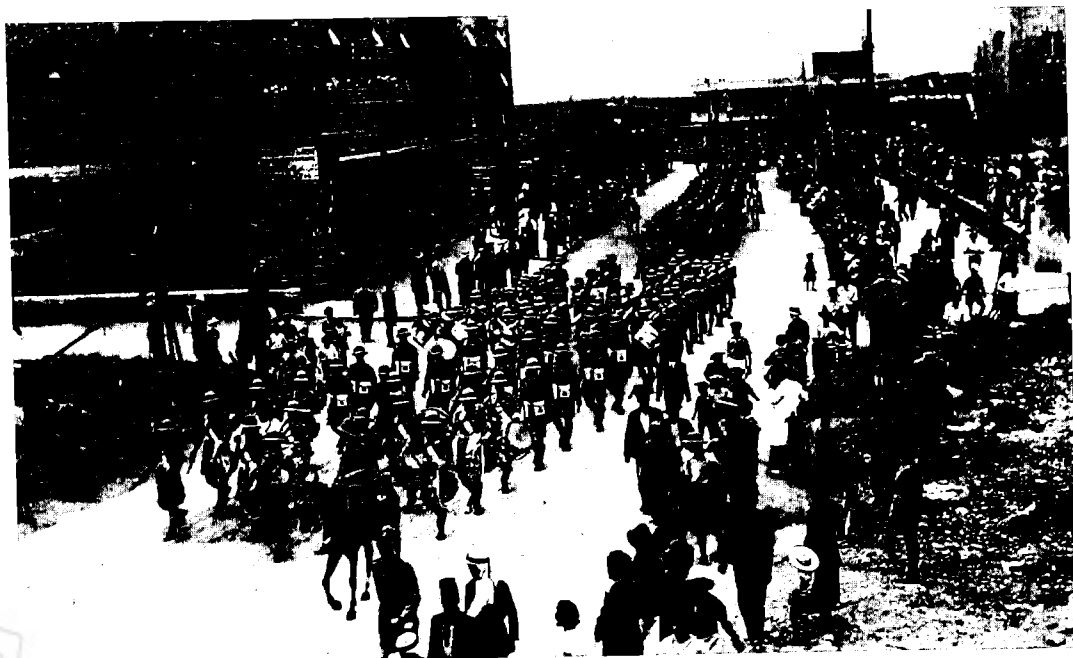
חגיגות יובל הכסף של שלטון המלך ג'ורג' החמישי, ירושלים (6 במאי 1935)