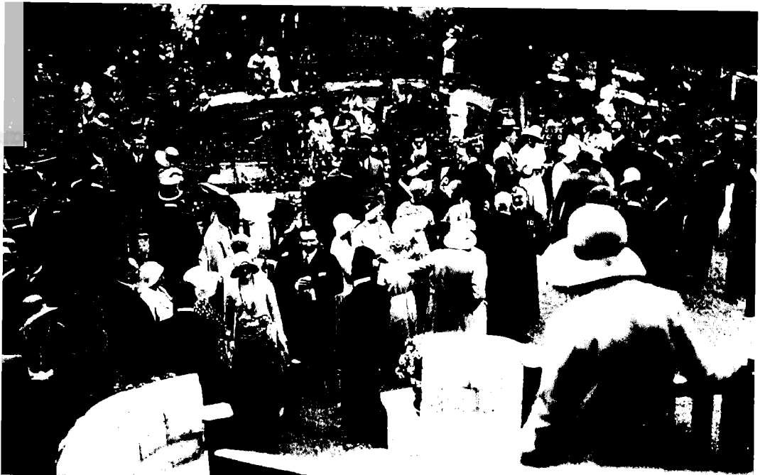
חגיגות יום-ההולדת של המלך ג'ורג' החמישי, בית הממשל, ירושלים (3 ביוני 1930)