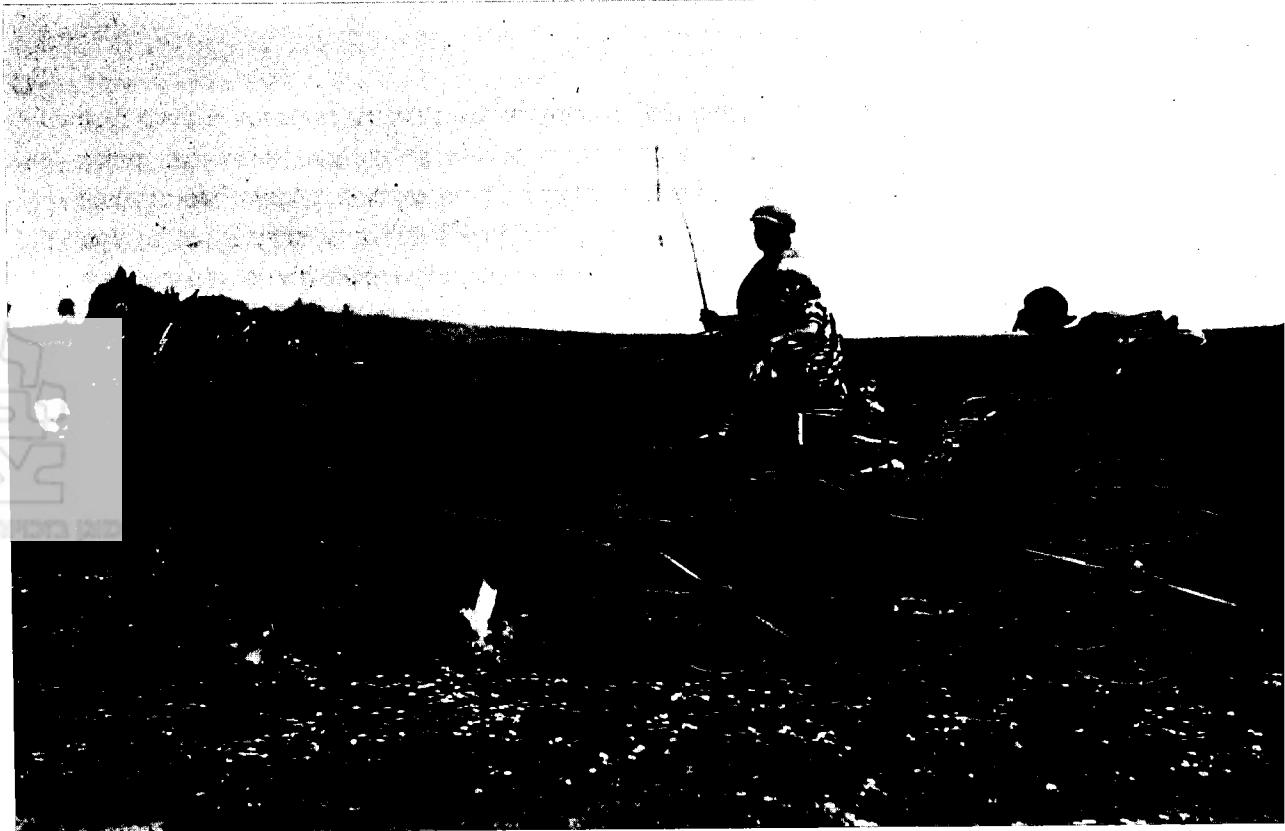
משפחת אורון (1922)