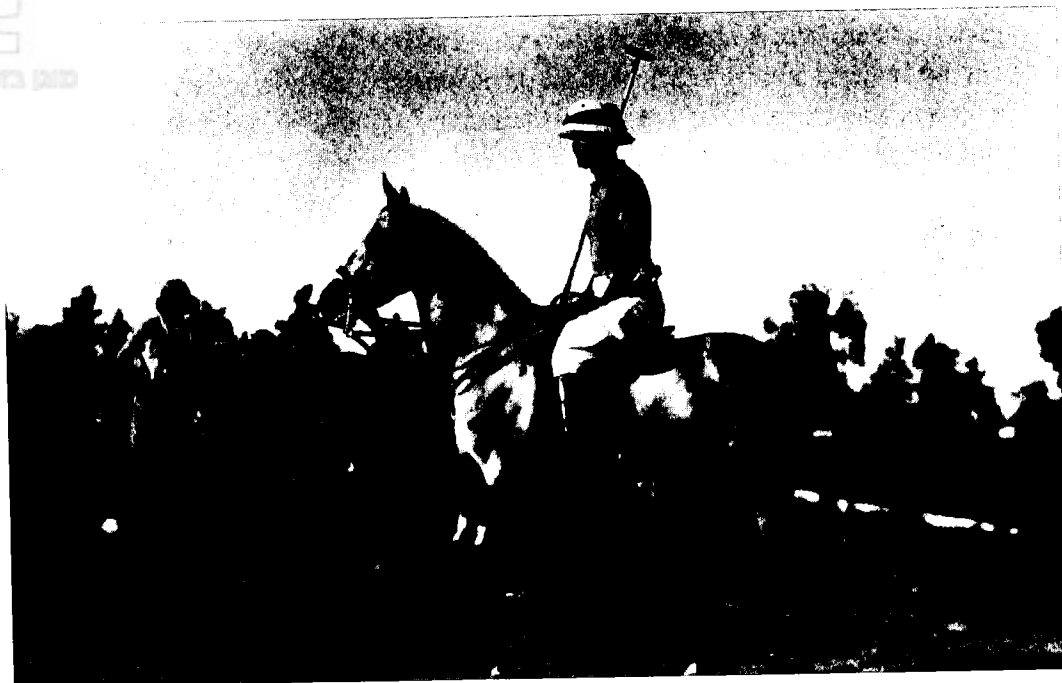
משחק פולו במחנה סרפנד (צריפין, 15 באוקטובר 1933)