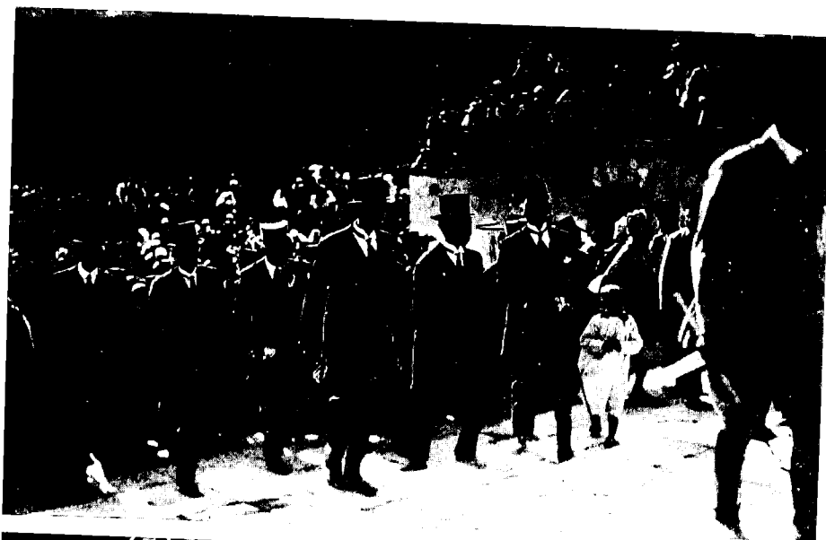
הלוויית המלך חוסיין, השריף של מכה (1931)