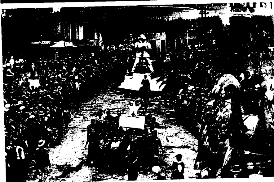
עדלאידע, תל-אביב (1934): על הקרונית של יהודי א"י דמות חלוץ ברגליו פשוקות ולפניה עגלת דרקון (בצד ימין למטה)