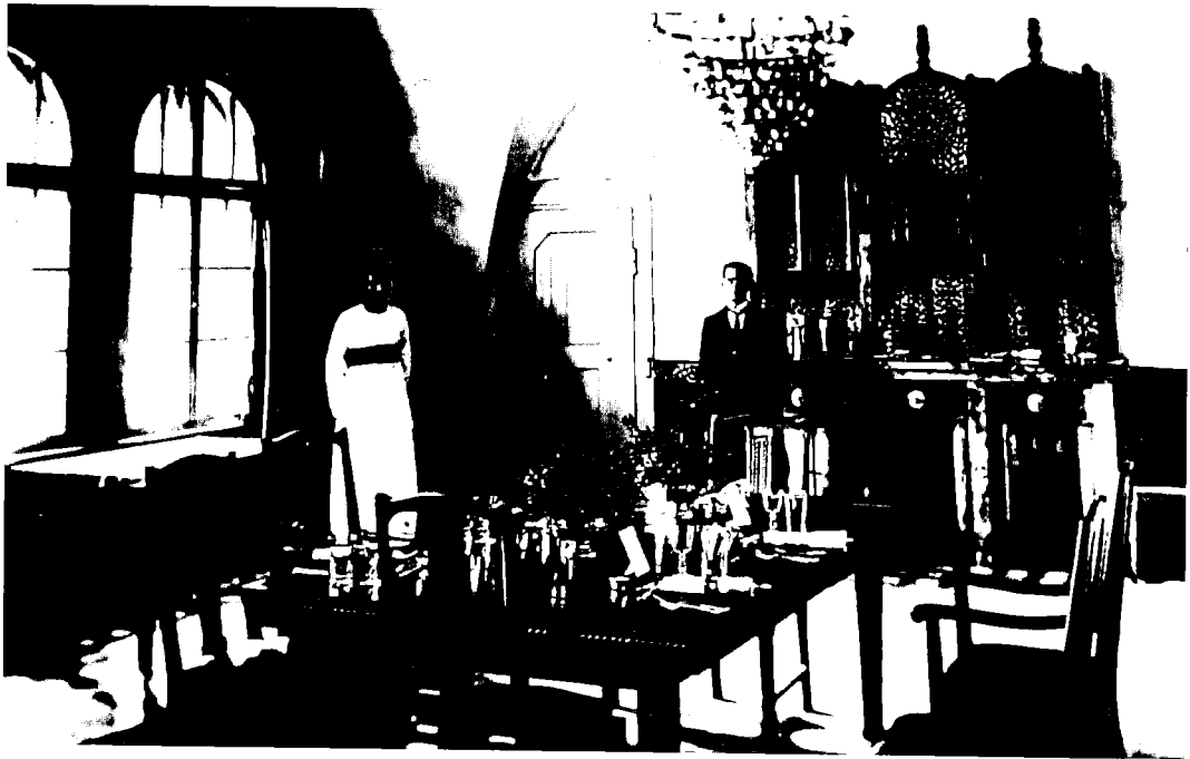
חדר האוכל בבית הממשל בירושלים (עומד: מאליה, המלצר המאלטזי, שנות העשרים)