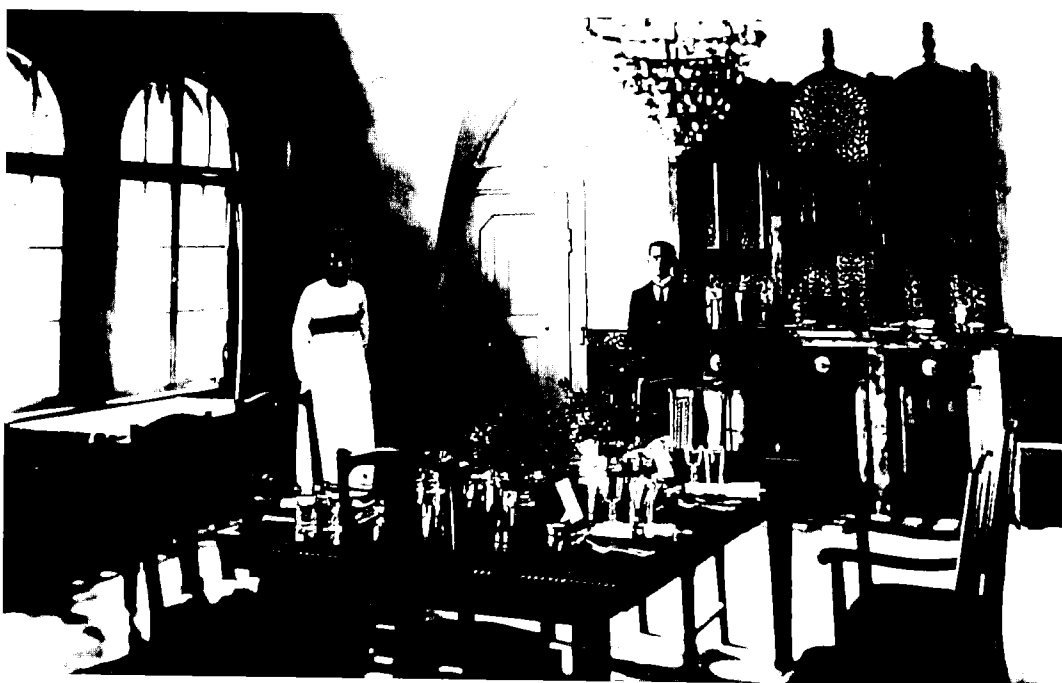
חדר האוכל בבית הממשל בירושלים (עומד: מאליה, המלצר המאלטזי, שנות העשרים)