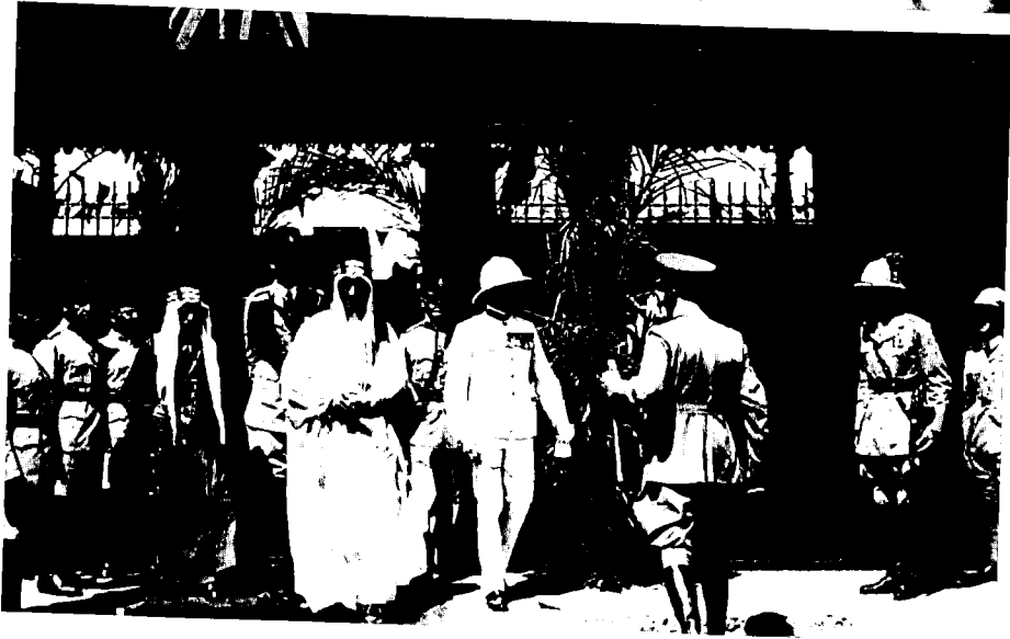
האמיר פויסל, יורש העצר הסעודי, בביקור רשמי בירושלים (14 באוגוסט 1935)