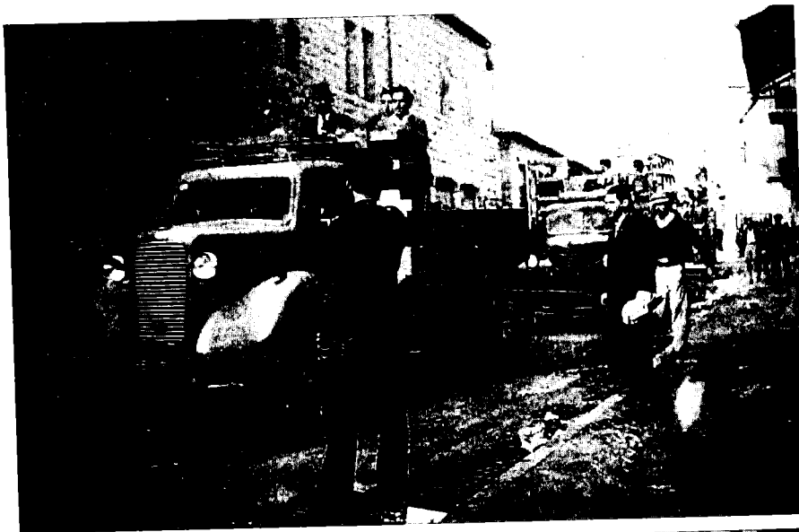
חגניות בבעלות יהודית עולות באש, ירושלים (2 בדצמבר 1947)