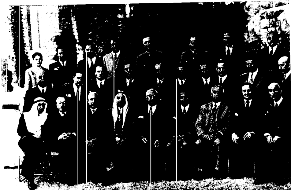
כינוס חברי הוועד הערבי העליון במלון 'המלך דוד', שבו הוכרז על הטלת חרם כלכלי על יהודי ארץ-ישראל (16 בנובמבר 1945). בין היושבים: חמושי מימין: ג'מיל מרדס בוי (לימים ראש ממשלת סוריה); שמיני מימין: עזני עבד-אל-האדי (ממייסדי התנועה הלאומית הערבית בארץ-ישראל) בין העומדים בשורה הראשונה: שישי מימין: ד"ר חוסיין פח'רי ח'אלידי (ראש עיריית ירושלים בשנים 1934-1937)