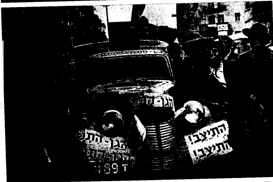
קריאה לגיוס כוחות יהודיים, ירושלים 1 (1 בדצמבר 1947)