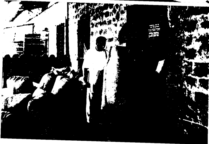
שקילת שקדים לייצוא, ראשון-לציון (שנות העשרים)