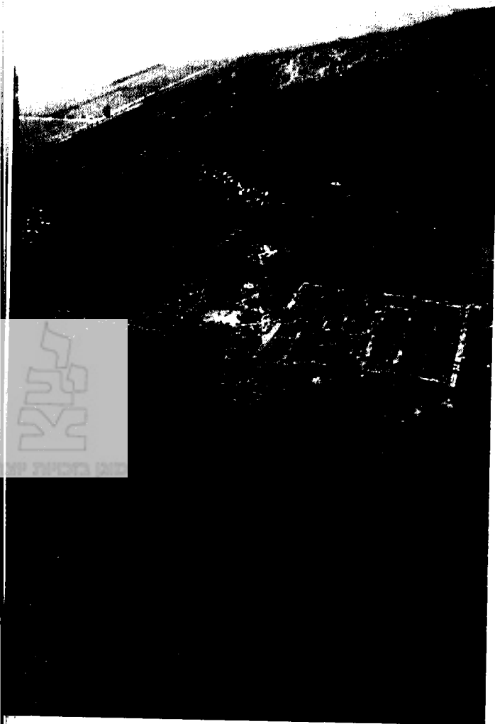
משמאל: צילום אוויר של בית האחוזת ברמת הגדיב (המאה הראשונה לפנה"ס - המאה הראשונה לספירה)