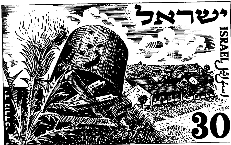
בול שעליו מגדל המים של יד-מרדכי (1952)

חלקו הראשון של המאמר מוקדש לדיון במגדלי המים של נגבה ושל יד-מרדכי, שכמו שרידי המשוריינים בדרך לירושלים והטנק בדגניה, מזוהים בתודעה הישראלית עם המיתוס ההרואי של מלחמת העצמאות. 3 ביטוי רשמי לכך ניתן עם הופעתם של מגדל המים של יד-מרדכי והטנק של דגניה על בולי יום הזיכרון לנופלים תשי"ב. העצמה הדרמטית של מצבות זיכרון אותנטיות אלה היא פועל יוצא של החשיבות שנודעה לסיפור הגבורה המקומי, אך בה בעת היא גם קשורה לכות השכנוע הרגשי שמיוחס לשרידי קרב אותנטיים ששימרו את האירועים הדרמטיים שלהם. 'עדים היסטוריים' כחלק מהמרקם הפיסי שלהם.