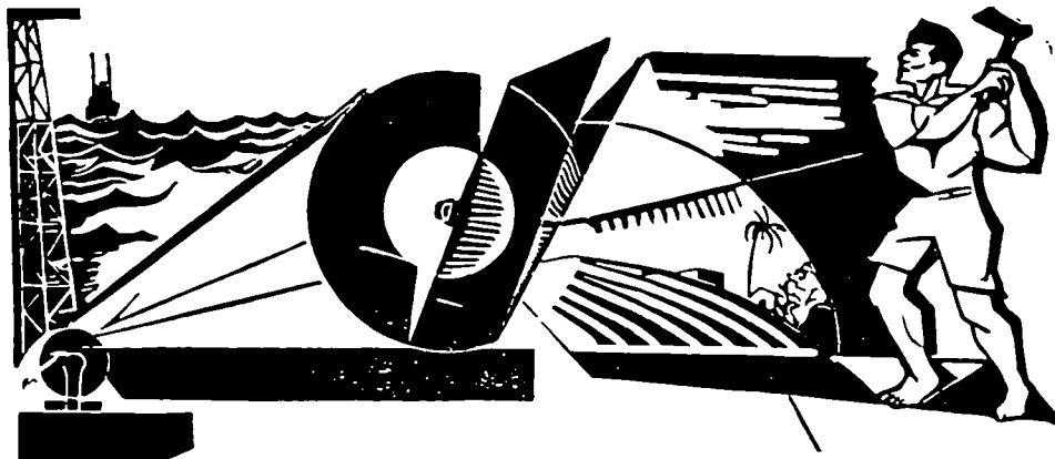
איור לכתיבה העת 'פלסטין' (אליהו סיגרד, 1929)

סטית התבטל ייחודו של העם היהודי. העמל הרב והיצירתיים שהושקעו ביצירת חברת מופת הולידו באורה פרוקסלי חברה יהודית 'נורמ-לית', עם שהוא 'ככל הגויים'. הסתירה האימננטית של הציונות, הרצון לעצב עם יהודי 'נורמלי' ו'נבחר' גם יחד, מתבטלת בחברה החדשנית של ברנפלד, ואולי אין ביטול זה אלא מימוש הסתירה.