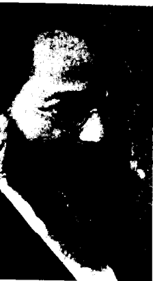
בוריס שץ (1932-1866)