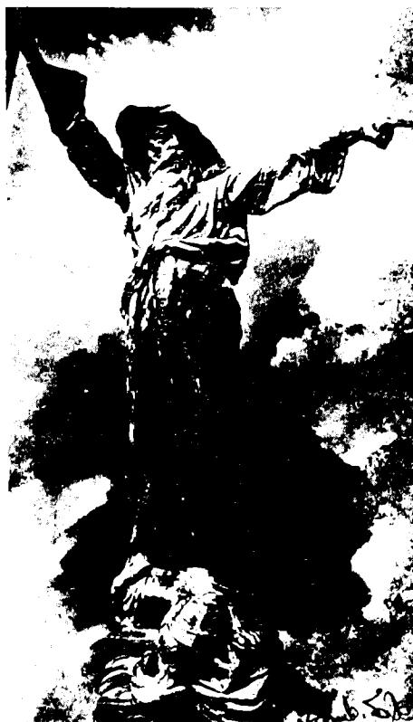
מתתיהו החשמונאי (פסל של בוריס שץ, 1894)

ראויה להדגשה העובדה שבכל האוטופיות הציוניות מצוירת במדינה העתידה חברת מופת. למרות העובדה ש'חיבת ציון' והתנועה הציונית צמחו במידה רבה בתגובה מידית לאנטישמיות, האוטופיה הציונית לא הרבתה להתעסק בשאלת האנטישמיות, אלא התעמקה בשאלת החברה היהודית החדשה שתקום בציון. ניתן לומר שהדחף ליצירת מקלט בטוח הוליד את הרצון לשקם את העם היהודי מבחינה חברתית ורוחנית. דבריו המפורסמים של יהודה לייב פינסקר בחוברתו 'אוטואמנציפציה' בדבר יצירת 'מקלט בטוח שאין עליו עוררין', לא סיפקו את מחברי