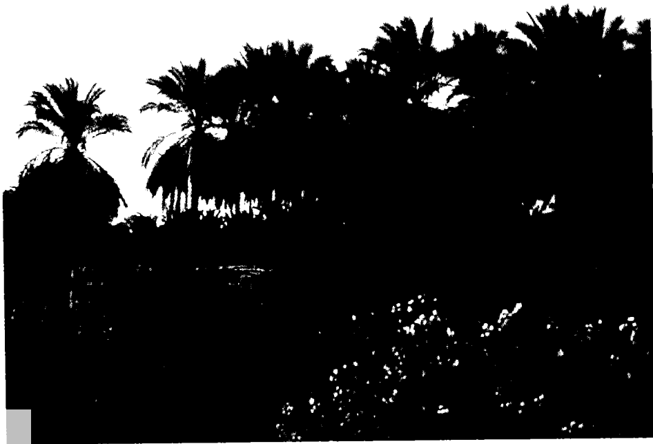
עצי תמר מהזן חיאני בגן רחל, קבוצת כינרת

מחזורי הירח והשמש, אלא שהם פירשו את הניב 'ממחרת השבת' כיום ראשון בשבוע שלאחר החג הראשון של פסח ולא ממש ממחרת הפסח, כלומר הם החלו את מניין העומר ביום א' הראשון של חול המועד.