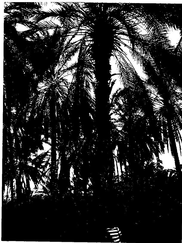
גן רחל – גן תמרים לזכרה של רחל המשוררת, בקבוצת כינרת