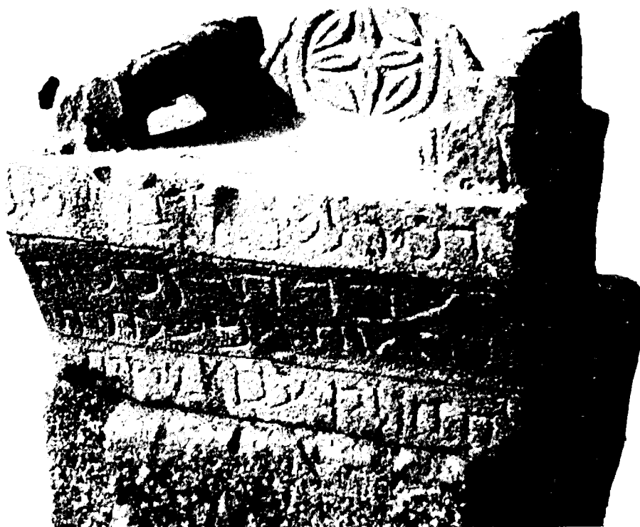
קתדרה דמשה מבית- הכנסת בכורזים

עולה בכל אחת ממעלות הכיסא היה הכרוז ומכריו על אחת ממצוות המלך, ומשבא לישב על המעלה השביעית היה הכרוז מכריו 'דע לפני מי אתה יושב!'. כאן ממשיך הדרשן ועוסק בכיסא שלמה, והוא מביא את הפסוק שנאמר בכיסא זה: "וראש עגול לכסא מאחריו" (מלכים א' י, יט) — א"ר אחא כהדא קתדרא דמשה, 22 ומוסיף: "וידות מזה ומזה".... האגדות על כיסא שלמה ועל המנגנון המותקן בו מופיעות בכמה מקומות נוספים בספרות חז"ל, ובעיקר במדרש אסתר רבה 23 ובתרגומים הארמיים למגילת אסתר (לפסוק השני של המגילה: 'כשבת המלך אחשוורוש על כסא מלכותו'), אך בכל המקורות הללו הדרשות ארוכות ונפתלות בהרבה מזו שבפסיקתא דרב כהנא.