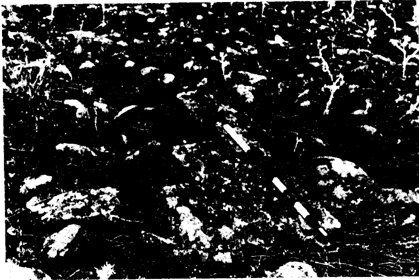
קתדרה דמשה בכורזים בעת חשיפתה

אחרים. 9 סוקניק חזר והזכיר את הנושא בדבריו על בית-הכנסת של כורזים בתוך הסקירה 'בתי כנסת עתיקים בסביבות ים כנרת' 10 אך לא הוסיף שם על דבריו הקודמים. לרשימת בתי-הכנסת העתיקים שבהם ידוע שהיתה קתדרה דמשה נוספו גם בית-הכנסת של עין-גדי וכנראה גם בית-הכנסת שבקירבת מושב דלתון בגליל העליון (לא הרחק מכפר נבוריא) וכן בית-הכנסת של דורא אירופוס. 11