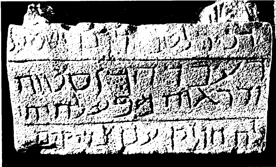
הכתובת בבסיס הקתדרה

התמיכה הממשית בצורה המקובלת והבלתי רגילה 'קתדרה דמשה' מבוססת אפוא על פרשנותו של מונח זה כבשורה של מתי ובהופעתו באחדים מכתבי-היד של פסיקתא דרב כהנא, אך לא ככולם, 44 ועל סיוע חלקי מתוך דברי האגדה. ההנחה שצורה זו היא המקורית והנכונה מתקבלת על הדעת, אך יש להודות כי אין בידינו לשלול לחלוטין את אמיתותה של הצורה החילופית 'קתדרא דרושה', המבוססת על עדי נוסח לא מעטים ולא מבוטלים.