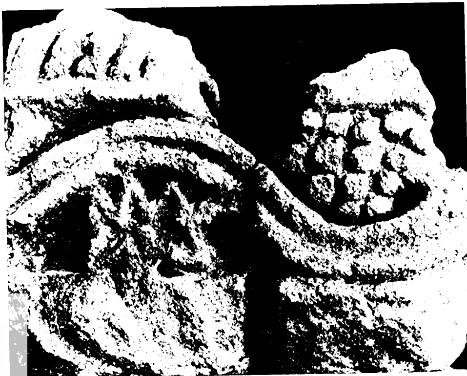
חורבת רימון – שבר אפריז המעוטר בשריגי גפן ואשכולות ענבים

היתה יהודית; 34 כן ידועים חכמים מעיר זו. על עקרון ודבורה אין בידינו נתונים מקבילים, וביוטה התגלו שרידים יהודיים ונוצריים ונראה שמדובר ביישוב מעורב או ביישוב יהודי שהתנצר, 35 ובכרמל נתגלו כאמור רק כנסיות. 36 ברשימה זו נוה יוצאת דופן: היא היתה פוליס ומסתבר שהקהילה היהודית בה היתה גדולה, אך עדיין אין בכך כדי להגדירה כ'עיר של יהודים'. חבל שאין ב'אונומסטיקון' תיאור של ערים נוספות כגון טבריה או ציפורי אשר בהן פעלו קהילות יהודיות מפוארות.