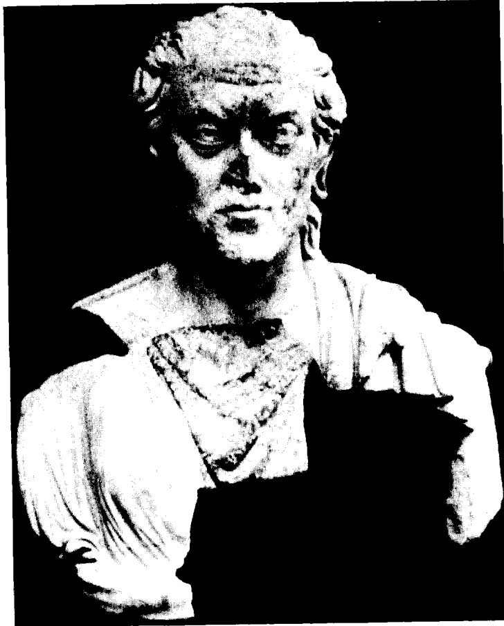
פסל של סופיסט מאפרודיסיאס שבאסיה הקטנה (מאה רביעית-חמישית לספירה)

הזה ממש: מידיעה בודדת אצל היירונימוס אנו למדים, 6 שבסילידס מסקיתופוליס היה ממוריו של הקיסר מרקוס אורליוס. ידיעה זו ממחישה לפנינו את החוגים ואת הסביבה התרבותית, שעמם ודאי נמנו מארחיו של אייליוס אריסטידס.