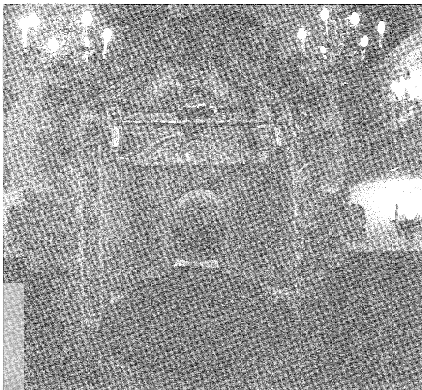
הגבהת ספר תורה עם 'שרביט'

במסכת סופרים...אמנם אין ספק דהאי לישנא דמסכת סופרים ומאי דאסמכך דבר זה אקרא דארור אשר לא יקים, אסמכתא בעלמא היא ולא דרשה גמורה דאכתי לא אישתמיט שום תנא ושום אמורא בתלמוד לומר דבר זה. והיה ראוי שיפרשו אותו בפ' אלו נאמרין (סוטה לט-מא) או בפ' הקורא (מגילה כא ואילך) אצל שאר דיני ספר תורה. 14